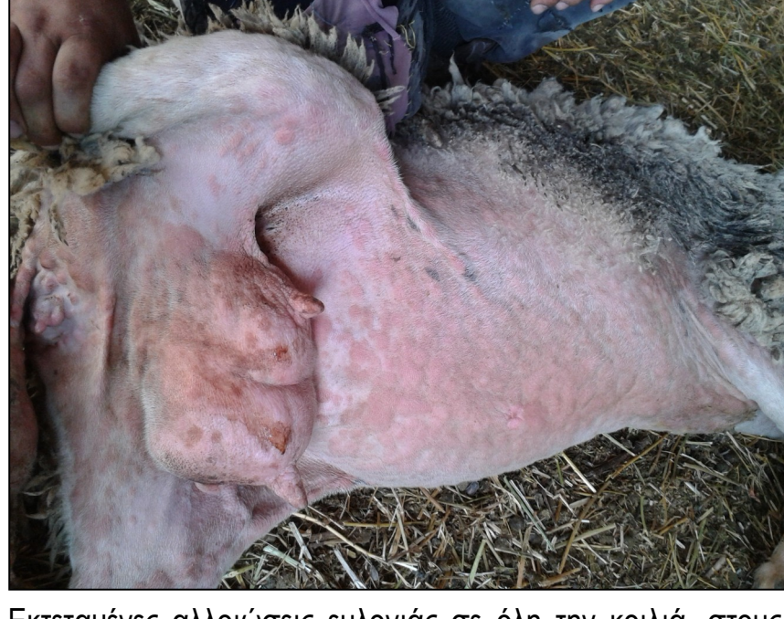
Εκτεταμένες αλλοιώσεις ευλογιάς σε όλη την κοιλιά, στους μαστούς, τους μηρούς ,τα γεννητικά όργανα και τη βάση της ουράς . Κοκκινίλες (κηλίδες) και κόκκινα σπυριά (βλατίδες).