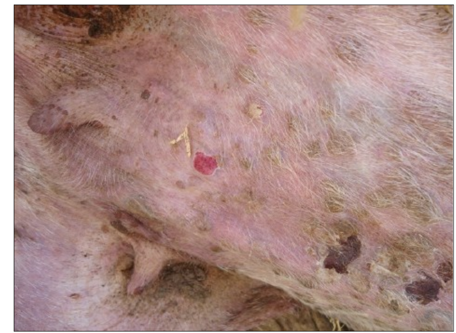
Προχωρημένες αλλοιώσεις ευλογιάς. Μαύρα κάπαλα (εφελκίδες) και πληγές (έλκη) στο ίδιο ζώο.