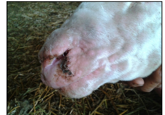
Πρόβατο με αλλοιώσεις ευλογιάς στο πρόσωπο. Κοκκινίλες (κηλίδες), κόκκινα σπυριά (βλατίδες).και μύξες (ρινικό έκκριμα).

<u>Φωτογραφίες αλλοιώσεων</u> Κωνσταντίνος Δαδούσης Άννα-Μαρία Μπάκα