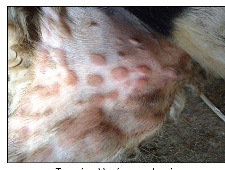
Τυπικές αλλοιώσεις ευλογιάς. Κόκκινα σπυριά (βλατίδες).