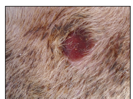
Προχωρημένες αλλοιώσεις ευλογιάς. Πληγές (έλκη).