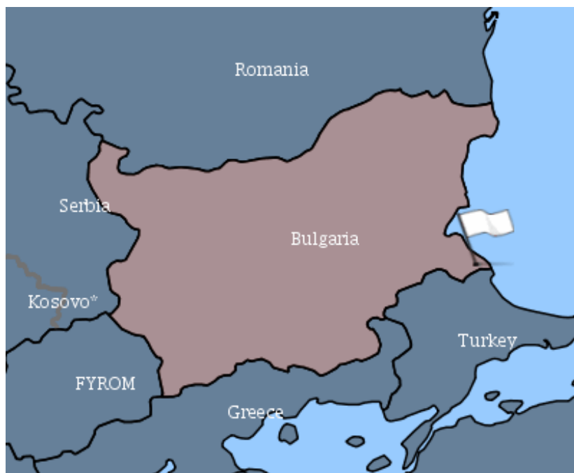
Εικόνα 1. Εστία Πανόλους Μικρών Μηρυκαστικών στη Βουλγαρία (village Kosti, Municipality Tsarevo, Region Burgas ).

B. Οι Κτηνιατρικές Υπηρεσίες των νησιών απέναντι από τα Παράλια της Τουρκίας παρακαλούνται να προβούν άμεσα στις παρακάτω ενέργειες: