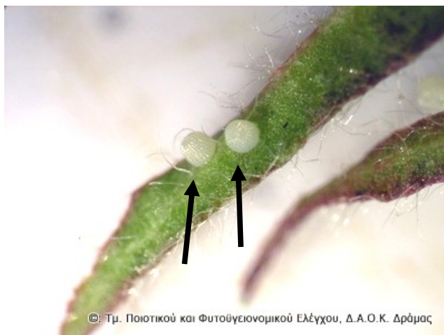
Αβγό σε μεγέθυνση