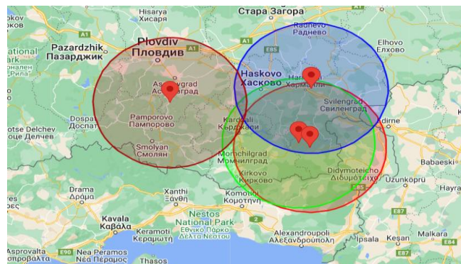
Εικόνα 2. Εστίες ΑΠΧ στη Βουλγαρία και ζώνη ακτίνας 50 χλμ.