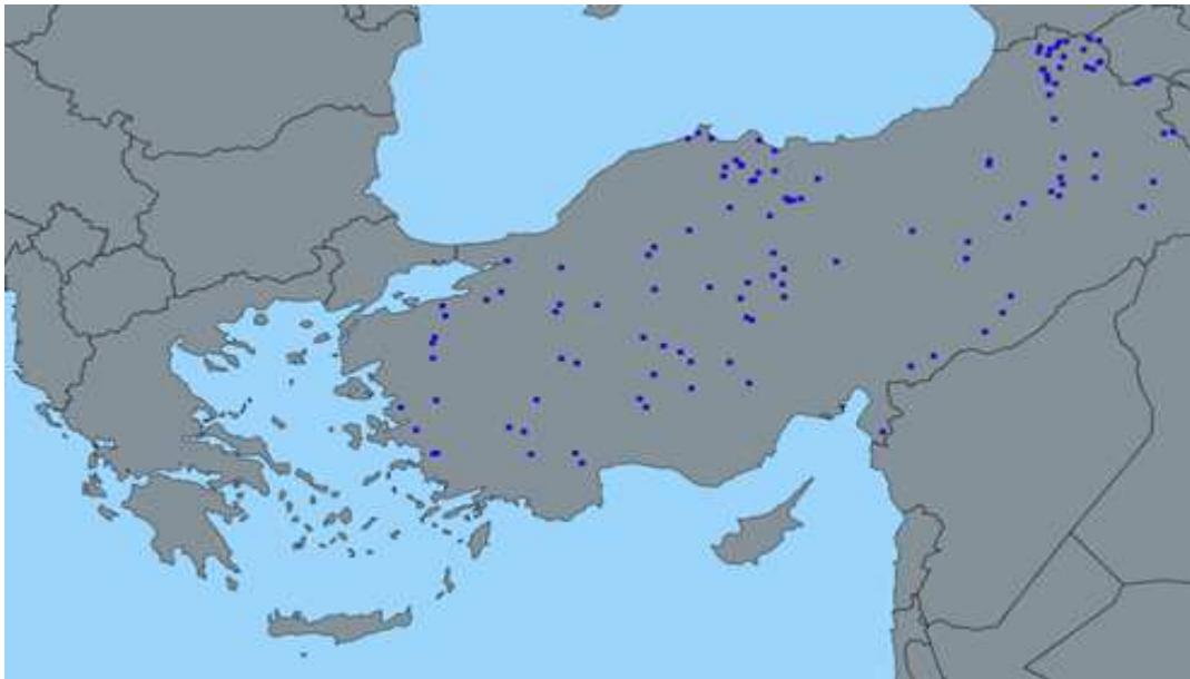
Εικόνα 2. Εστίες (121) Αφθώδους Πυρετού στην Τουρκία από 01.01.2020.

Επισημαίνεται ότι ο ΑΠ είναι νόσημα υποχρεωτικής δήλωσης που προσβάλλει όλα τα δίχηλα ζώα, σύμφωνα με την ισχύουσα εθνική και ενωσιακή νομοθεσία και, σε περίπτωση επιβεβαίωσης εστίας, τίθενται σε εφαρμογή τα οριζόμενα: