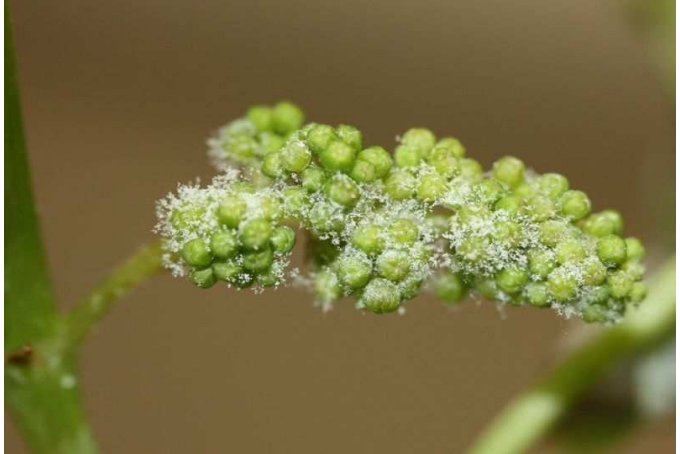
Εξανθήσεις του μύκητα στην κάτω επιφάνεια του φύλλου και σε μούρο (νεαρή ταξιανθία).

ΣΥΣΤΑΣΗ: Καλούνται οι καλλιεργητές, ιδίως αυτήν την εποχή, να επισκέπτονται όσο το δυνατό συχνότερα τις καλλιέργειες, προκειμένου να διαπιστώνουν έγκαιρα τυχόν προσβολές από φυτοπαράσιτα, έτσι ώστε να είναι εφικτή η αποτελεσματική αντιμετώπισή τους, με το μικρότερο οικονομικό και περιβαλλοντικό κόστος.