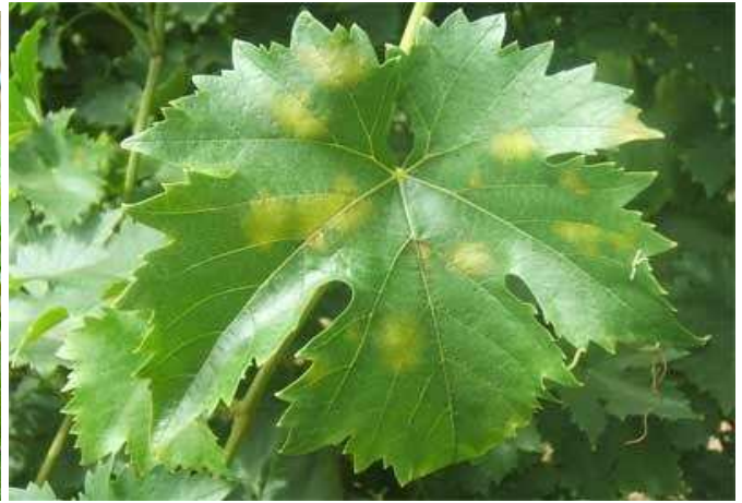
Προχωρημένη προσβολή φύλλων, όπως αυτή φαίνεται στην πάνω επιφάνεια.