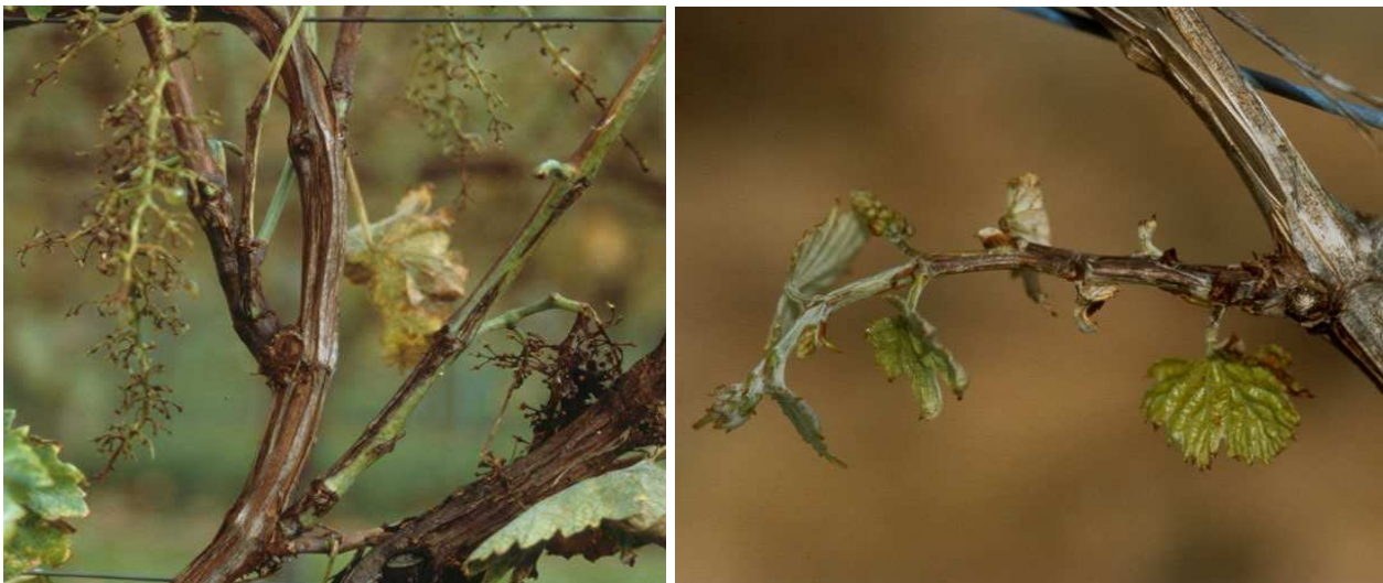
Εικ. Χαρακτηριστικά επιμήκη έλκη της ασθένειας σε κληματίδες./Προσβεβλημένος τρυφερός βλαστός.

Προκαλεί ξηράνσεις κεφαλών και βραχιόνων, με αποτέλεσμα τη σταδιακή εξασθένηση των πρέμνων και την έξοδό τους από την παραγωγή. Τα συμπτώματα της ασθένειας είναι ορατά με την έναρξη της βλάστησης. Ορισμένες κεφαλές του προσβεβλημένου πρέμνου δεν βλαστάνουν ή δίνουν ασθενικούς βλαστούς που αποξηραίνονται αργότερα. Συνήθως η προσβολή εντοπίζεται προς τη μία πλευρά του πρέμνου. Ευπαθείς στις μολύνσεις είναι οι τρυφερές κληματίδες μέχρι μήκους 10 εκ. Η μετάδοση της ασθένειας ευνοείται από βροχερό καιρό και σε μεγάλο θερμοκρασιακό εύρος (0°C–30°C). Μεγαλύτερη ευπάθεια στη βακτηρίωση παρουσιάζουν οι ποικιλίες Σουλτανίνα και Ραζακί.