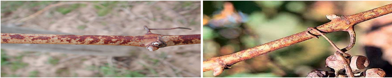
Εικ. Χαρακτηριστική προσβολή κληματίδων από ωίδιο.