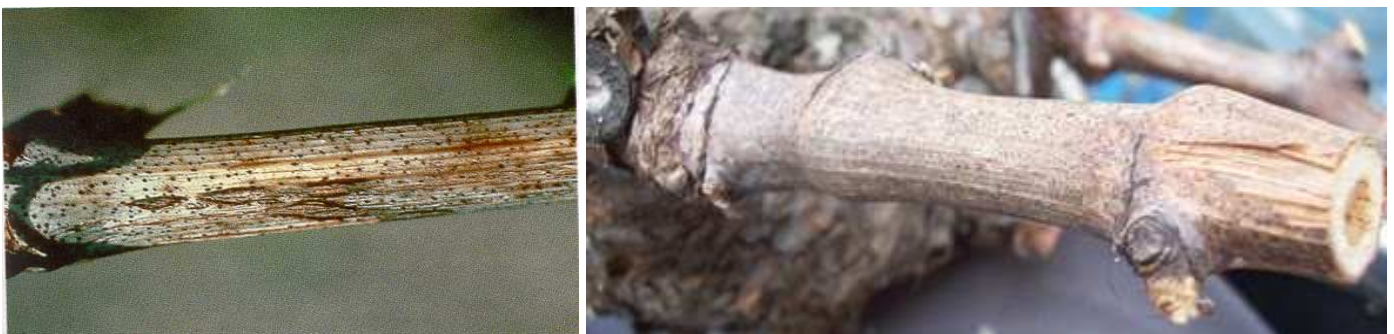
Εικ. Χαρακτηριστική προσβολή κληματίδων από φόμοψη—μακρόφομα.

1. ΦΟΜΟΨΗ—ΜΑΚΡΟΦΟΜΑ. Πρόκειται για μυκητολογικές ασθένειες που προκαλούνται από συγγενείς μύκητες, οι οποίοι διαχειμάζουν υπό μορφή πυκνιδίων στην επιφάνεια των προσβεβλημένων κληματίδων. Για το λόγο αυτό, οι προσβεβλημένες κληματίδες πρέπει να απομακρύνονται άμεσα και να καίγονται. Ο χαλκός συμβάλει την καταστροφή των πυκνιδίων.