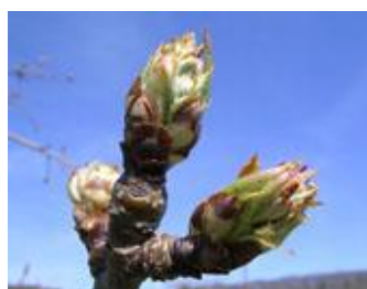
Τρυφερή βλάστηση 1,5 εκ.