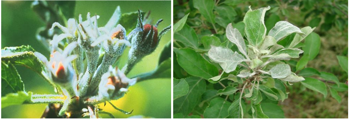
Συμπτώματα οιδίου σε νεαρή βλάστηση (ροζέτες) μηλιάς.