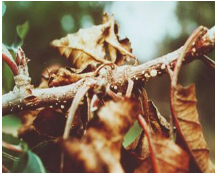
Προσβολή μονιλίας σε κλαδίσκους μηλιάς.