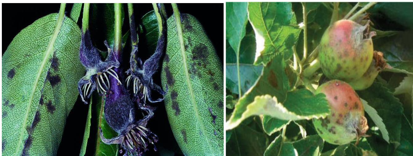
Συμπτώματα φουζικλαδίων σε φύλλα, άνθη & καρπούς αχλαδιάς & μηλιάς

Επισημαίνεται ότι: 1) οι παραπάνω ψεκασμοί είναι ιδιαίτερα σημαντικοί, διότι περιορίζουν σημαντικά τον κίνδυνο μελλοντικών μολύνσεων, 2) εγκεκριμένα χαλκούχα σκευάσματα μπορούν με ασφάλεια να χρησιμοποιηθούν μόνο στους δύο πρώτους ψεκασμούς, 3) σε περίπτωση που επικρατούν βροχοπτώσεις κατά την περίοδο της καρπόδεσης και της ανάπτυξης των νεαρών καρπών και ανάλογα πάντα με το ιστορικό προσβολής του οπωρώνα, συστήνεται η συνέχιση των ψεκασμών όσο διαρκεί η βροχερή περίοδος και ανάλογα με τη διάρκεια δράσης των μυκητοκτόνων, 4) για την αποφυγή ανάπτυξης ανθεκτικότητας των μυκήτων συνιστάται η εναλλαγή μυκητοκτόνων από διαφορετικές χημικές ομάδες, 5) ενθαρρύνεται η χρήση του μικροβιακού σκευάσματος με βάση το βακτηριακό στέλεχος Bacillus subtilis QST 713.