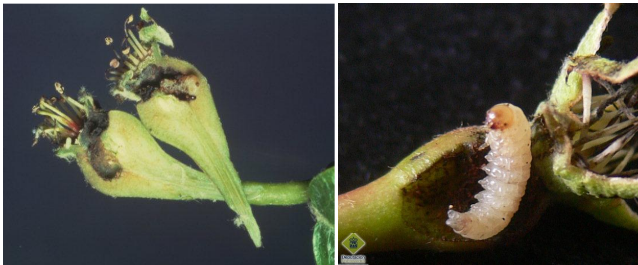
Προσβολή νεαρών αχλαδιών από προνύμφες οπλοκάμπης.

Το έντομο ωτοκεί στον κάλυκα των ανθέων και οι εκκολαπτόμενες προνύμφες ορύσσουν στοές στους αναπτυσσόμενους καρπούς, οι οποίοι πολύ σύντομα μαυρίζουν και πέφτουν. Ορισμένες χρονιές οι ζημιές που προκαλούνται από το έντομο είναι σημαντικές. Συνιστάται η διενέργεια ενός ψεκασμού με κατάλληλο και εγκεκριμένο εντομοκτόνο αμέσως μετά την άνθηση, μόνο σε οπωρώνες που παρουσίασαν προσβολή από το έντομο την προηγούμενη καλλιεργητική περίοδο.