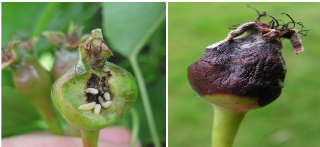
Προσβολή κηκιδόμυγας σε νεαρούς καρπούς αχλαδιάς.

Οι προνύμφες του εντόμου δραστηριοποιούνται στο εσωτερικό των νεαρών καρπών και προκαλούν παραμορφώσεις. Οι καρποί στη συνέχεια μαυρίζουν και πέφτουν. Συνιστάται η διενέργεια ενός ψεκασμού με κατάλληλο και εγκεκριμένο εντομοκτόνο πριν την άνθηση και όταν τα κλειστά άνθη είναι διογκωμένα, μόνο σε οπωρώνες που παρουσίασαν σοβαρή προσβολή από το έντομο την προηγούμενη καλλιεργητική περίοδο.