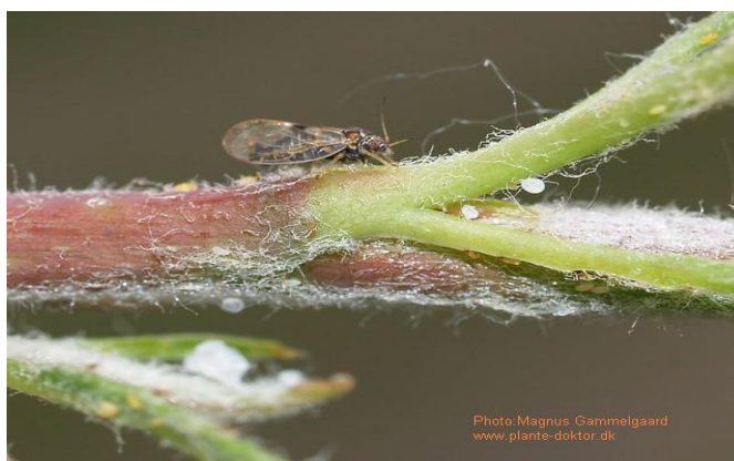
Προσβολή ψύλλας σε τρυφερή βλάστηση αχλαδιάς.