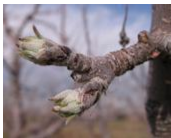
Βλάστηση 1,5 εκ