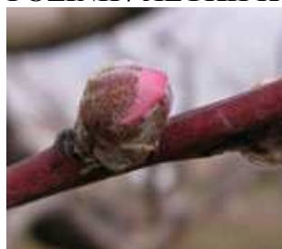
Ροδακινιά / Νεκταρινιά