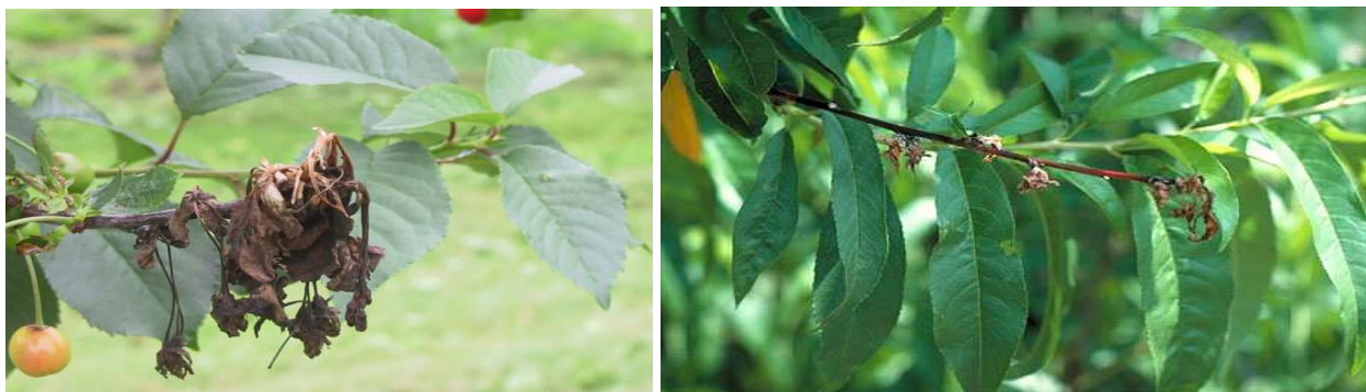
Προσβολή κερασιάς και ροδακινιάς από Μονίλια.

Για την αποφυγή ανάπτυξης ανθεκτικότητας του μύκητα, συνιστάται η συνεχής εναλλαγή μυκητοκτόνων από διαφορετικές χημικές ομάδες.