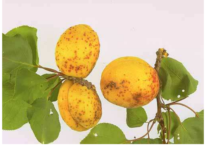
Σύμπτωμα κορύνεου σε ροδάκινα και βερίκοκα