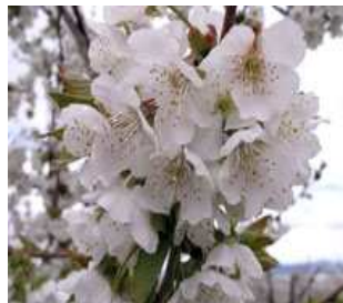
Κερασιά / Βυσσινιά