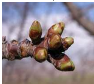
Κερασιά / Βυssινιά