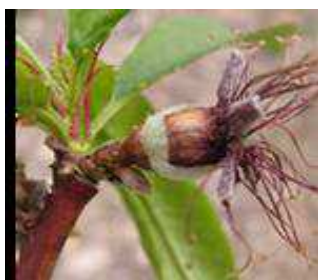
Ροδακινιά / Νεκταρινιά