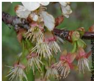
Κερασιά / Βυσσινιά