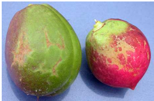
Προσβολή θρίπα σε νεκταρίνια.