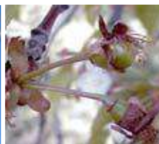
Κερασιά / Βυσσινιά