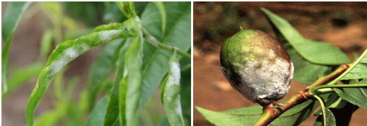
Σύμπτωμα ωιδίου σε νεκταρινιά

Οι ψεκάσμοι αυτοί θα μπορούσαν να συνδυαστούν με εκείνο για τη Φαιά Σήψη (Μονίλια).