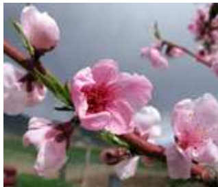
Ροδακινιά / Νεκταρινιά