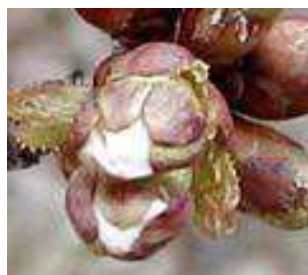
Κερασιά / Βυssινιά