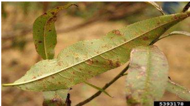
Σύμπτωμα σκωρίασης σε φύλλα ροδακινιάς.

Ο ψεκάσμος αυτός θα μπορούσε να συνδυαστεί με εκείνο για τη Φαιά Σήψη (Μονίλια)