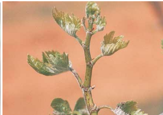
Νεαροί βλαστοί με έντονη προσβολή από ωίδιο ( Uncinula necator )