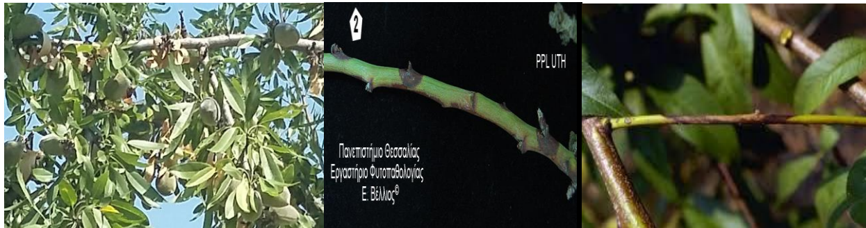
Εικ.1 Π.Κ,Π,Φ Βόλο Fusicoccum amygdali

Phomopsis amygdali (συν. Fusicoccum amygdali )