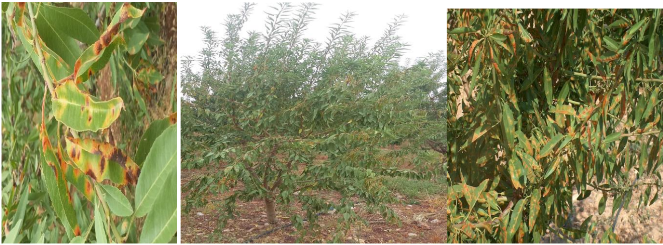
Εικ.4 5.6 ΠΚΠ.Φ Βόλου Προσβολή από ΠΟΛΥΣΤΙΓΜΩΣΗ ( Polystigma ochraceum )

Αναμένεται η εμφάνιση της πολυστίγμωσης μετά τις βροχοπτώσεις σε Αμυδαλεώνες του Ν. Μαγνησίας (Ν. Αγχίαλος, Κανάλια) καθώς και σε περιοχές του Ν. Λάρισας και Ν. Φθιώτιδας.