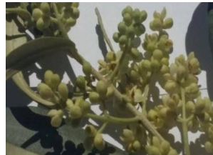
Έναρξη άνθησης (στάδιο F)