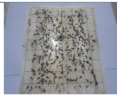
Ακμαία του πυρηνοτρήτη σε παγίδα του ΠΚΠΦ Βολου

Διαπιστώσεις: Η πτήση της ανθόβιας γενιάς του πυρηνοτρήτη βρίσκεται σε εξέλιξη. Οι συλλήψεις των ακμαίων του πυρηνοτρήτη στο δίκτυο φερομονικών παγίδων συνεχίζονται και εμφανίζονται πολύ υψηλοί πληθυσμοί του εντόμου στους νομούς Μαγνησίας, Φθιώτιδας και Λάρισας. Αναμένονται εναποθέσεις αυγών και εκκολάψεις προνυμφών στο κρόκκιασμα - αρχή άνθησης.