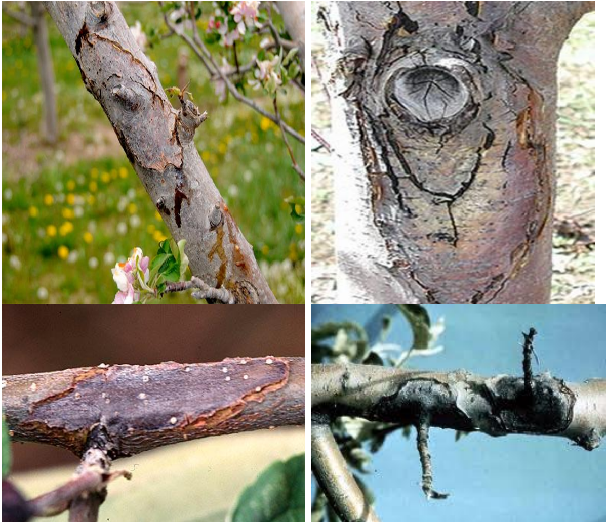
Εικ. Χαρακτηριστικές προσβολές (έλκη) του βακτηρίου στον κορμό και σε κλάδους

Προσοχή: Σε κάθε περίπτωση να τηρούνται αυστηρά οι οδηγίες χρήσης των φυτοπροστατευτικών προϊόντων για την αναλογία χρήσης, την συνδυαστικότητα, τον κίνδυνο φυτοτοξικότητας, το διάστημα μεταξύ τελευταίας επέμβασης και συγκομιδής και τα μέτρα προστασίας για την αποφυγή δηλητηρίασης.