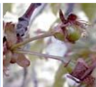
Κερασιά / Βυσσινιά