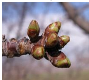
Κερασιά / Βυσσινιά