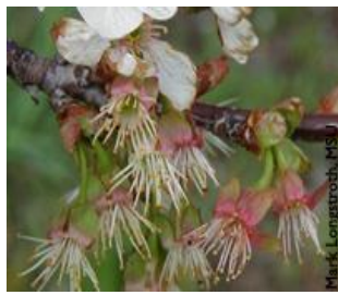
Κερασιά / Βυσσινιά