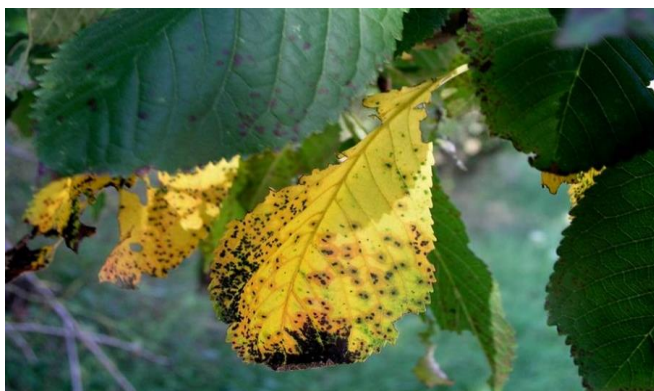
Σύμπτωμα κυλινδροσπορίωσης σε φύλλα κερασιάς

Ο ψεκασμός αυτός θα μπορούσε να συνδυαστεί με εκείνο για τη Φαιά Σήψη (Μονίλια).