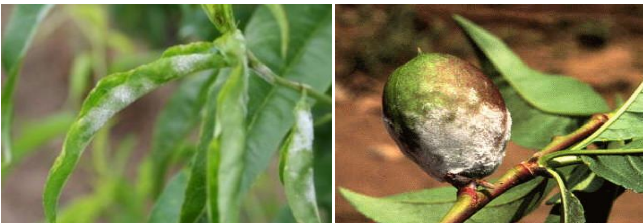
Σύμπτωμα ωιδίου σε νεκταρινιά

Οι ψεκασμοί αυτοί θα μπορούσαν να συνδυαστούν με εκείνο για τη Φαιά Σήψη (Μονίλια).