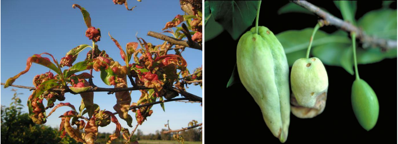
Σύμπτωμα εξώασκου σε φύλλωμα ροδακινιάς και σε καρπούς δαμασκηνιάς

Ο ψεκασμός αυτός θα μπορούσε να συνδυαστεί με εκείνο για τη Φαιά Σήψη (Μονίλια).