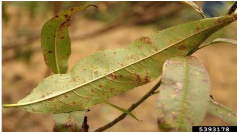
Σύμπτωμα σκωρίασης σε φύλλα ροδακινιάς.

Ο ψεκασμός αυτός θα μπορούσε να συνδυαστεί με εκείνο για τη Φαιά Σήψη (Μονίλια)