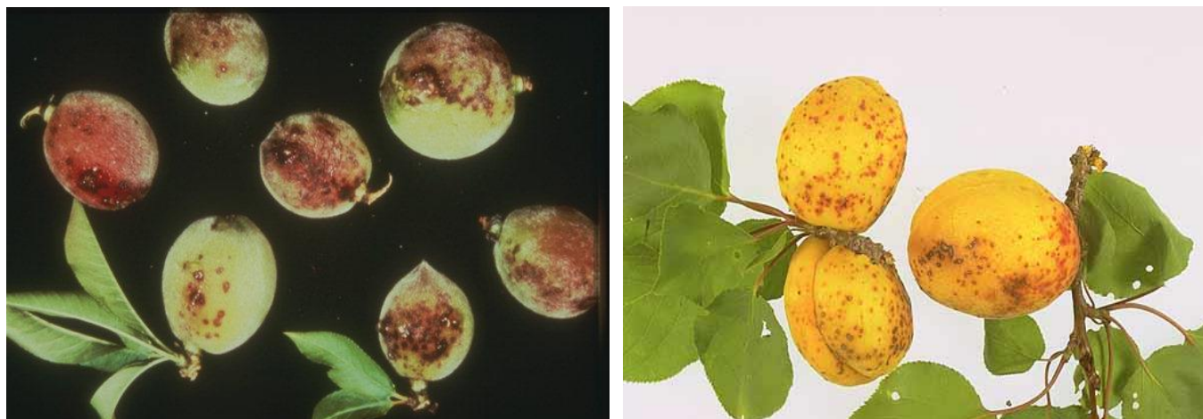
Σύμπτωμα κορύνεου σε ροδάκινα και βερίκοκα

Ο ψεκασμός αυτός θα μπορούσε να συνδυαστεί με εκείνο για τη Φαιά Σήψη (Μονίλια), κάνοντας χρήση μυκητοκτόνου που καταπολεμεί και τις δύο ασθένειες.