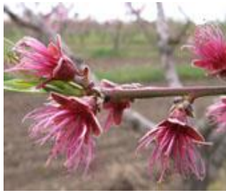
Ροδακινιά / Νεκταρινιά