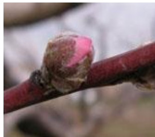
Ροδακινιά / Νεκταρινιά