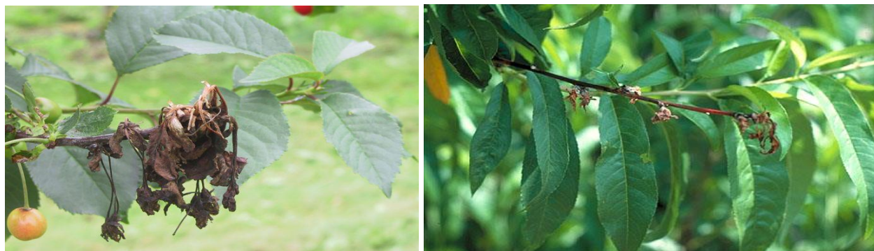
Προσβολή κερασιάς και ροδακινιάς από Μονίλια.

Για την αποφυγή ανάπτυξης ανθεκτικότητας του μύκητα, συνιστάται η συνεχής εναλλαγή μυκητοκτόνων από διαφορετικές χημικές ομάδες.