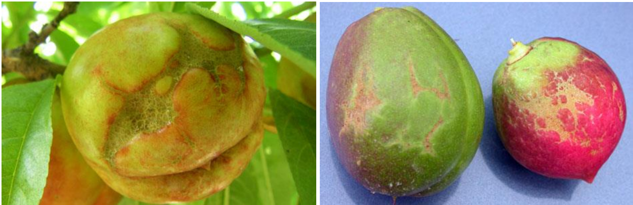
Προσβολή θρίπα σε νεκταρίνια.

Η καταστροφή των ζιζανίων, κυρίως αυτών που είναι ανθισμένα, μέσα και γύρω από τις καλλιέργειες, αποτελεί σημαντικό μέτρο περιορισμού των προσβολών των ανθέων των καλλιεργειών από τους θρίπες.