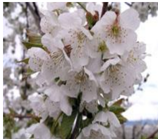
Κερασιά / Βυσσινιά