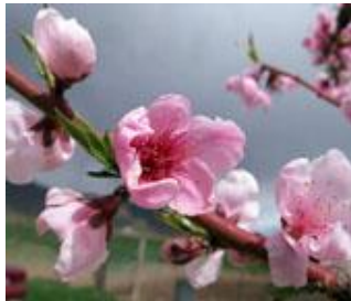
Ροδακινιά / Νεκταρινιά