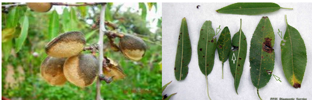
Εικόνα 6-Προσβολή από Ανθράκωση