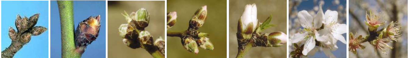
A Διάπαυση B Διόγκωση οφθαλμών C Πράσινη Κορυφή D Ροζ Κορυφή E Λευκή κορυφή F Πλήρης άνθηση G Πτώση πετάλων

Από παρατηρήσεις διαπιστώθηκε ότι οι πρώιμες ποικιλίες στις πρώιμες περιοχές βρίσκονται στο στάδιο της πράσινης ή ροζ κορυφής.