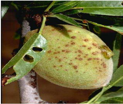
Εικόνα 3 Συμπτώματα κορύνεου σε φύλλα (τρύπες από σκάγια), βλαστό και καρπό