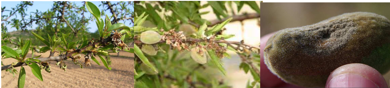
Εικόνα 1. Συμπτώματα μονιλίας σε βλαστούς και καρπό αμυγδαλιάς

Αποτελεί μεγάλης οικονομικής σημασίας ασθένεια της αμυγδαλιάς. Η είσοδος του παθογόνου στο δένδρο γίνεται από οποιοδήποτε μέρος του άνθους και από τους καρπούς. Ο μύκητας διαχειμάζει στα έλκη, στους μουμιοποιημένους καρπούς και στους αποξηραμένους κλάδους.