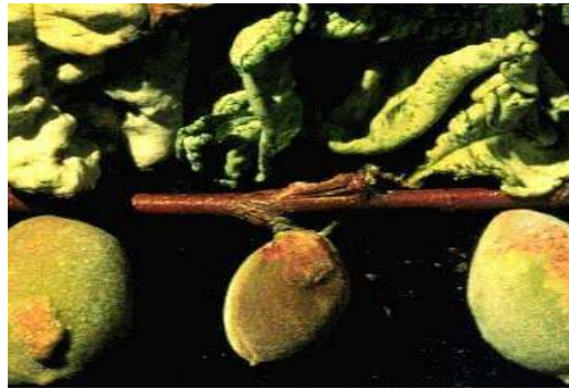
Εικόνα 2 Συμπτώματα εξώασκου σε φύλλα και καρπούς αμυγδαλιάς

Μυκητολογικές ασθένειες που προσβάλλουν τα φύλλα, τα άνθη και στη συνέχεια και τους καρπούς.