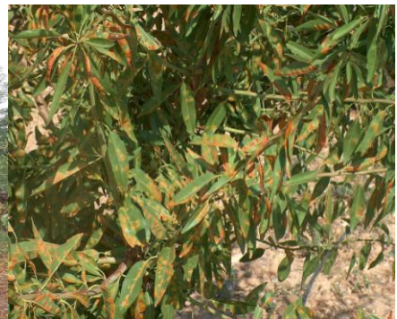
Εικ.4 5.6 ΠΚΠ.Φ Βόλου Προσβολή από ΠΟΛΥΣΤΙΓΜΩΣΗ ( Polystigma ochraceum )

Συνεχίζεται η παρουσία της πολυστίγμωσης σε Αμυγδαλεώνες του Ν. Μαγνησίας (Νέα Αγχιάλος, Κανάλια) καθώς και σε περιοχές των Ν. Λάρισας και Φθιώτιδας.