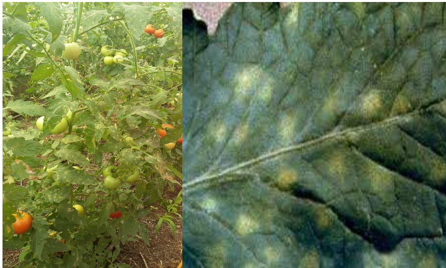
Κλαδοσπόριο σε θερμοκήπιο Ν.Μαγνησίας

Διαπιστώσεις: Συνεχίζεται η παρουσία του κλαδοσπόριου στις καλλιέργειες με τομάτες θερμοκηπίου. Οι καιρικές συνθήκες που επικρατούν είναι ευνοϊκές για τη ανάπτυξη του μύκητα και την μετάδοσή του.