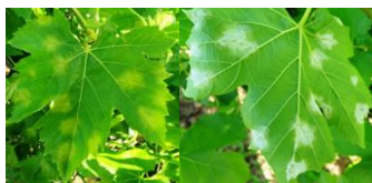
Κηλίδες και εξανθήσεις