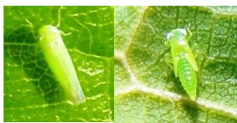
Τέλειο και νόμφη. Πτερωτό και άπτερο