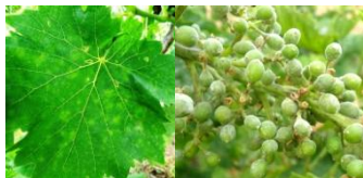
Δευτερογενείς μολύνσεις σε φύλλα και σταφύλια