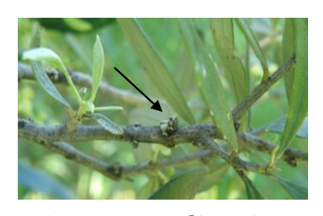
Πολλίνια: Κοκκοειδές γκρίζου χρώματος. Εξασθενημένη βλάστηση.