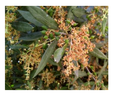
Ανομοιόμορφη καρπόδεση. Βλαστικά στάδια G, Η, Ι (Πτώση πετάλων - Καρπόδεση - Καρποί μεγέθους σταριού).

Στις μεσοπρώιμες περιοχές ολοκληρώνεται η καρπόδεση (στάδιο H ) και οι καρποί αποκτούν μέγεθος κόκκου σταριού (στάδιο Ι). Παρατηρείται ανομοιομορφία στην καρπόδεση.