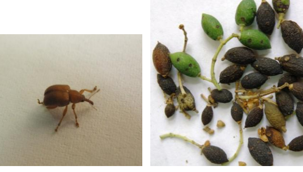
<u>Ρυγχίτης</u> : Ακμαίο και νεαροί προσβεβλημένοι καρποί.