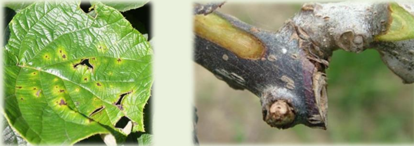
Εικ. 2&3 Βακτηριακό έλκος σε ακτινιδιά

Η μεταφορά μολύσματος μπορεί να γίνει με τον αέρα, τη βροχή, από διάφορα ζώα, τον άνθρωπο, τα διάφορα καλλιεργητικά εργαλεία ενώ σε μεγάλες αποστάσεις μεταφέρεται κυρίως με μολυσμένο πολλαπλασιαστικό υλικό.