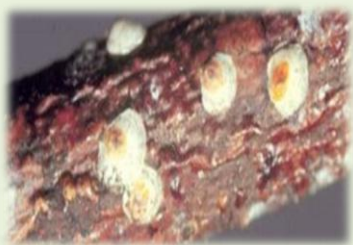
Εικ. 1 Βαμβακάδα

Η βαμβακάδα αποτελεί πολύ σοβαρό εχθρό της ακτινιδιάς προσβάλλοντας τον κορμό, τα κλαδιά και τους καρπούς. Πολλαπλασιάζεται με μεγάλη ταχύτητα και έχει τρεις γενεές το έτος. Το έντομο απομυζά χυμούς από το φυτό προκαλώντας την εξασθένησή του και σταδιακά την ξήρανση των κλαδιών. Σημαντικές είναι οι ζημιές στους καρπούς, όπου στα σημεία προσβολής πληγώνεται η επιδερμίδα με αποτέλεσμα να αναπτύσσονται σήψεις, να μειώνεται ο χρόνος διατήρησης των καρπών και τελικά να υποβαθμίζεται η ποιότητα και η εμπορική τους αξία.