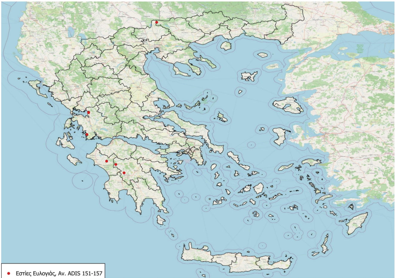
Εικόνα 1. Νέες Επιβεβαιωμένες Εστίες Ευλογίας (27 Μαΐου - 5 Ιουνίου).

Κατόπιν διαβούλευσης με τις αρμόδιες υπηρεσίες της Ευρωπαϊκής Επιτροπής, ενσωματώθηκαν στο Παράρτημα της Εκτελεστικής Απόφασης (ΕΕ) 1366/2026 της 12 ης Ιουνίου 2026, σχετικά με την τροποποίηση της εκτελεστικής απόφασης (ΕΕ) 2024/2207 για ορισμένα μέτρα έκτακτης ανάγκης σχετικά με την ευλογία των αιγοπροβάτων. Στο πλαίσιο αυτό οριοθετήθηκαν οι παρακάτω ζώνες στις Π.Ε. Έβρου, Ροδόπης, Ξάνθης, Καβάλας, Θάσου, Δράμας, Σερρών, Κιλκίς, Χαλκιδικής, Πέλλας, Ημαθίας, Πιερίας, Κοζάνης, Λάρισας, Μαγνησίας, Καρδίτσας, Τρικάλων, Ευρυτανίας, Φθιώτιδας, Εύβοιας, Φωκίδας, Αιτωλοακαρνανίας, Αχαΐας, Ηλείας, Αρκαδίας, Μεσσηνίας, Λακωνίας, Αργολίδας, Κεφαλληνίας, Πρέβεζας, Άρτας, Θεσπρωτίας, Λευκάδας, Ιθάκης και στη Μ.Ε. Θεσσαλονίκης ως ακολούθως (Εικόνα 2):