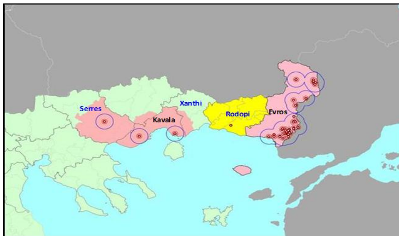
Εικόνα 2. Ζώνες Προστασίας, Επιτήρησης και Περαιτέρω Απαγορευμένη Ζώνη στις Π.Ε. Έβρου, Ροδόπης, Ξάνθης, Καβάλας, Σερρών και Δράμας.

Κατόπιν διαβούλευσης με τις αρμόδιες υπηρεσίες της Ευρωπαϊκής Επιτροπής, πρόκειται να ενσωματωθούν στο Παράρτημα της Εκτελεστικής Απόφασης, αναφορικά με ορισμένα μέτρα έκτακτης ανάγκης σχετικά με την ευλογία των αιγοπροβάτων και οριοθετούνται οι παρακάτω ζώνες στις Π.Ε. Έβρου, Ροδόπης, Ξάνθης, Καβάλας, Σερρών και Δράμας ως ακολούθως (Εικόνα 2):