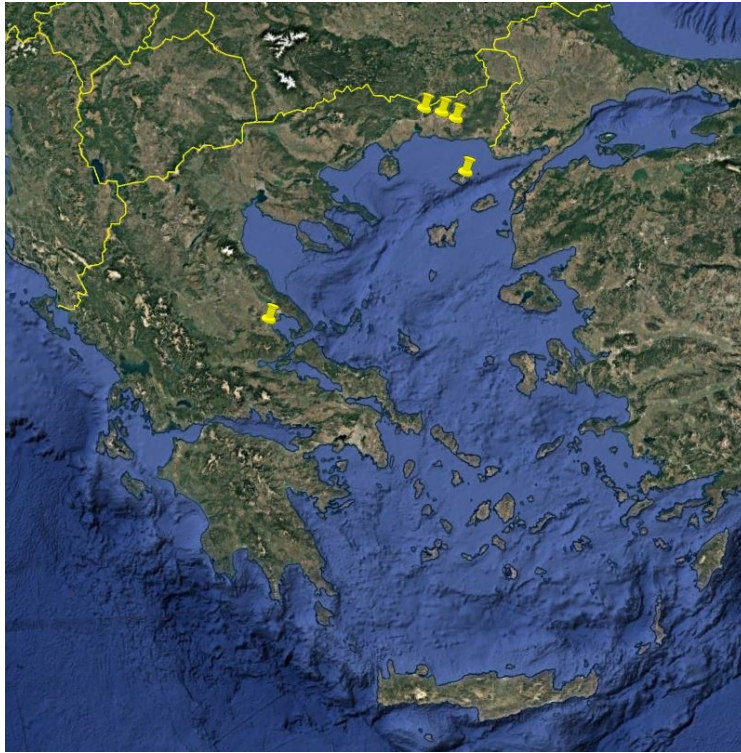
Εικόνα 1. Εστίες Ευλογιάς (Αναφορές ADIS Ap. 2025/048 έως 2025/052).

Κατόπιν διαβούλευσης με τις αρμόδιες υπηρεσίες της Ευρωπαϊκής Επιτροπής, ενσωματώθηκαν στο Παράρτημα της Εκτελεστικής Απόφασης (ΕΕ), αναφορικά με ορισμένα μέτρα έκτακτης ανάγκης σχετικά με την ευλογία των αιγοπροβάτων και οριοθετούνται οι παρακάτω ζώνες στις Π.Ε. Έβρου, Ροδόπης, Ξάνθης, Καβάλας, Δράμας, Χαλκιδικής, Μαγνησίας και Σποράδων, Φθιώτιδας, Φωκίδας, Αιτωλοακαρνανίας, Ηρακλείου, στη Μητροπολιτική Ενότητα Θεσσαλονίκης, στον Δήμο Σαμοθράκης και στον Δήμο Σκύρου ως ακολούθως (Εικόνα 2):