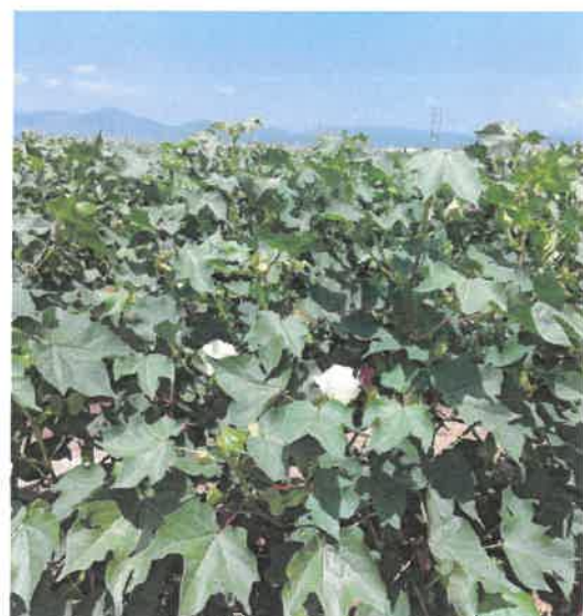
Φωτογραφίες ΔΑΟΚ Ξάνθης (2023)