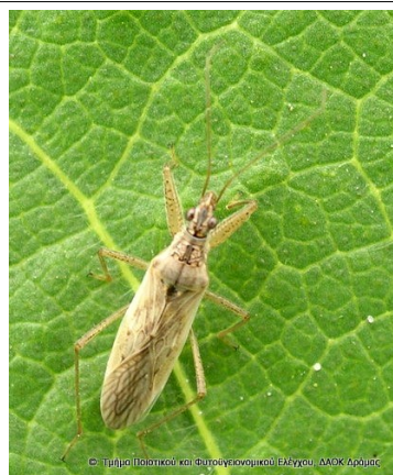
Nabis pseudoferus (αρπακτικό ημίπτερο της οικ. Nabidae)