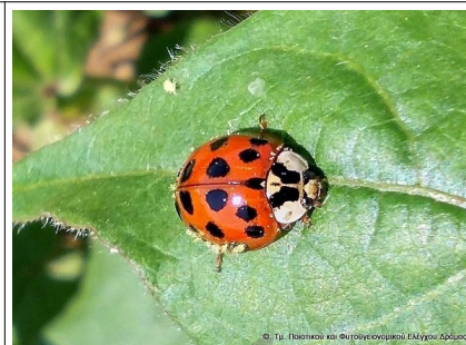
Η ασιατική πασχαλίτσα ( Harmonia axyridis )