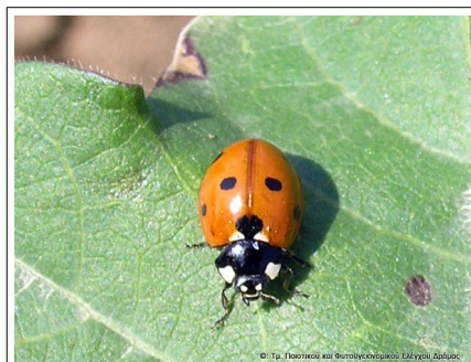
Η κοινή πασχαλίτσα ( Coccinella septempunctata )