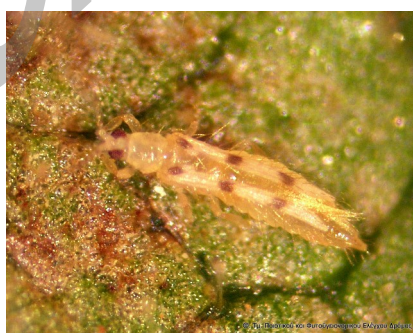
Scolothrips spp. Ενήλικο άτομο (αρπακτικός θρίπας).