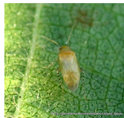
Camptylomma verbasci (αρπακτικό ημίπτερο της οικ. Miridae).