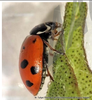
Είδος πασχαλίτσας ( Hippodamia variegata )