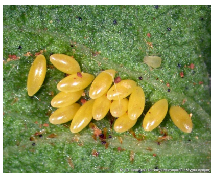
Αβγά της κοινής πασχαλίτσας