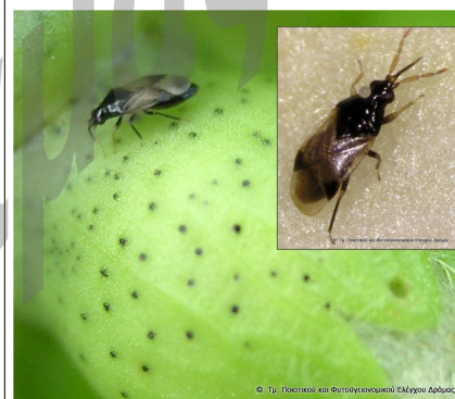
Orius spp. (αρπακτικό ημίπτερο της οικ. Anthocoridae).