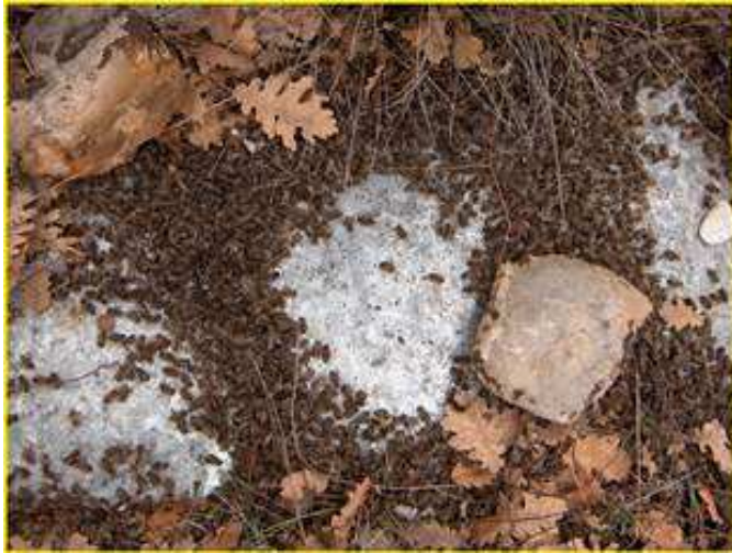
Νεκρές μέλισσες μπροστά από την κυψέλη