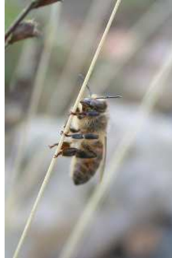
Μέλισσα που είναι προσκολλημένη στο γρασίδι