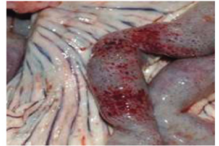
Υπεραιμία του βλενογόνου του εντέρου.

Η ΕΠΙΒΕΒΑΙΩΣΗ ΤΟΥ ΝΟΣΗΜΑΤΟΣ ΓΙΝΕΤΑΙ ΜΟΝΟ ΕΡΓΑΣΤΗΡΙΑΚΑ!!