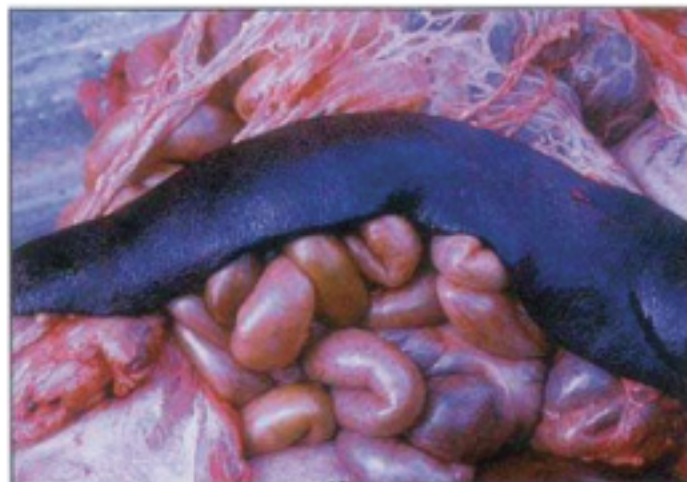
Σπλήνας διογκωμένος και σκουρόχρωμος.