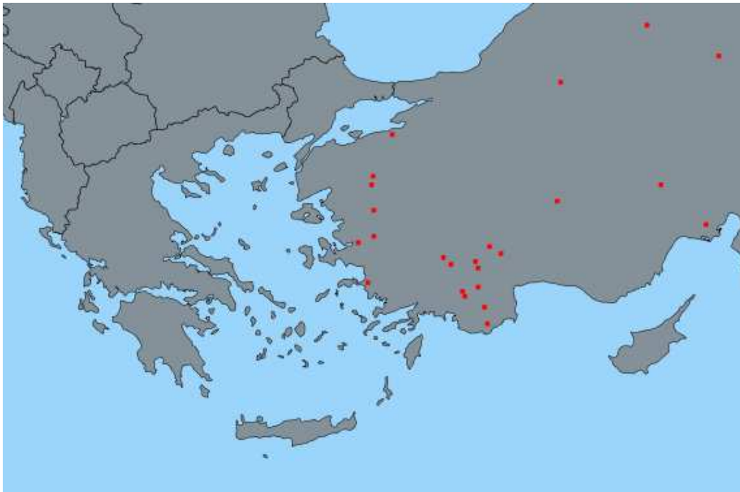
Εικόνα 2. Εστίες Αφθώδους Πυρετού από 18/11/2017 στη γειτονική Τουρκία.

Υπενθυμίζεται, ότι πρόκειται για νόσημα που προσβάλλει όλα τα δίχηλα ζώα, είναι υποχρεωτικής δήλωσης, σύμφωνα με την ισχύουσα εθνική και ενωσιακή νομοθεσία και, σε περίπτωση επιβεβαίωσης, τα μέτρα καθορίζονται από: