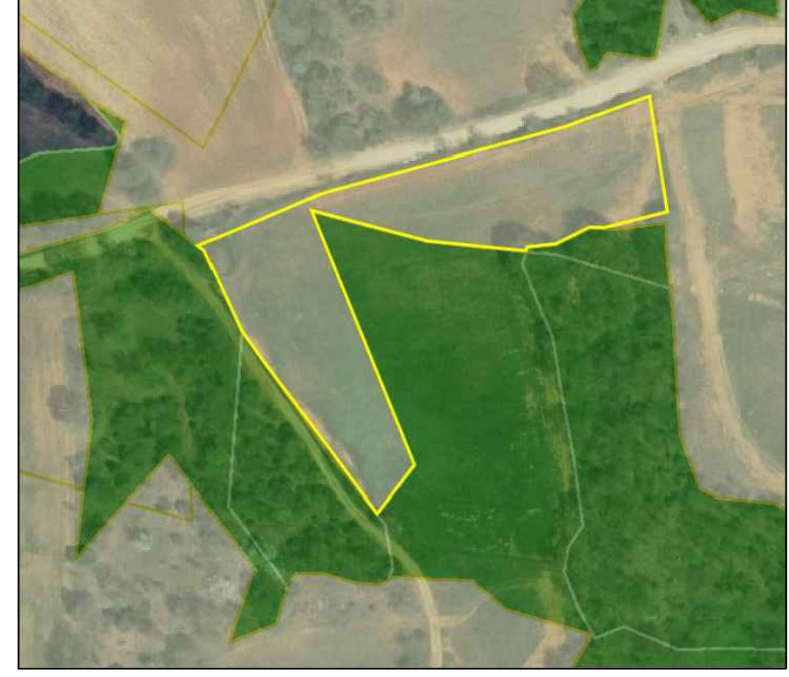
Απόσπασμα δασικού χάρτη