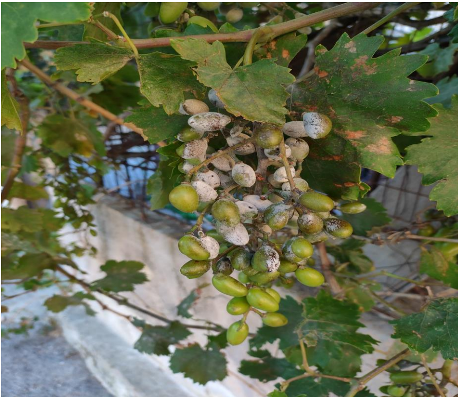
Ισχυρή προσβολή ωιδίου σε βότρου και φύλλωμα.

Το στάδιο της καρπόδεσης και οι 2-3 εβδομάδες που ακολουθούν είναι μία περίοδος πολύ κρίσιμη για την ανάπτυξη της ασθένειας και οι ζημιές που προκαλούνται είναι συνήθως καταστροφικές για την καλλιέργεια. Η προστασία των βοτρυών από τον μύκητα σε αυτή την περίοδο θεωρείται επιβεβλημένη. Επιπλέον, οι καιρικές συνθήκες των τελευταίων ημερών είναι ιδιαίτερα ευνοϊκές για την γρήγορη επέκταση της ασθένειας.