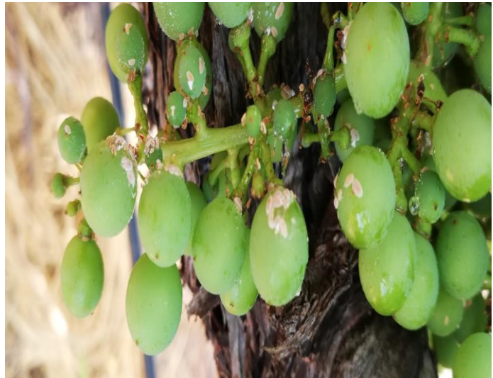
Αποικίες ψευδόκοκκων κάτω από ρυτιδώματα πρέμνου και πάνω στον βότρυ.