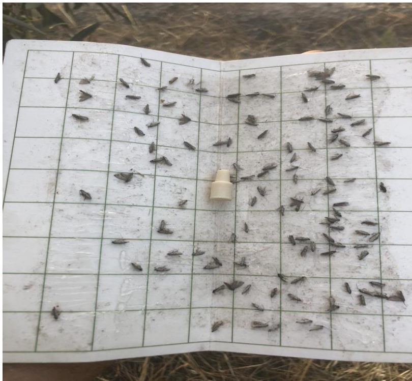
Αρσενικά ακμαία πυρηνοτρήτη σε κολλώδη επιφάνεια φερομονικής παγίδας.

Για το λόγο αυτό επισημαίνεται ότι κάθε ελαιώνας πρέπει να αντιμετωπίζεται ως ιδιαίτερη περίπτωση όσον αφορά την πορεία πτήσης των ακμαίων του πυρηνοτρήτη. Κάθε καλλιεργητής οφείλει να παρακολουθεί την πορεία πτήσης του εντόμου μέσω του δικτύου φερομονικών παγίδων στον ελαιώνα του.