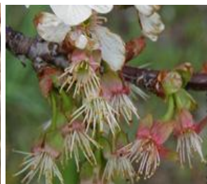
Κερασιά / Βυσσινιά