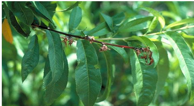
Προσβολή κερασιάς και ροδακινιάς από Μονίλια.