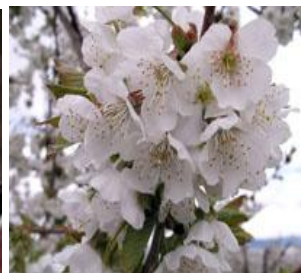
Κερασιά / Βυσσινιά