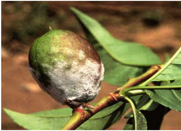
Σύμπτωμα ωιδίου σε νεκταρινιά