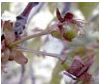
Κερασιά / Βυσσινιά