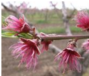
Ροδακινιά / Νεκταρινιά