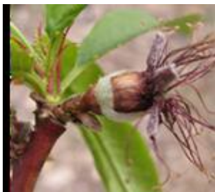
Ροδακινιά / Νεκταρινιά