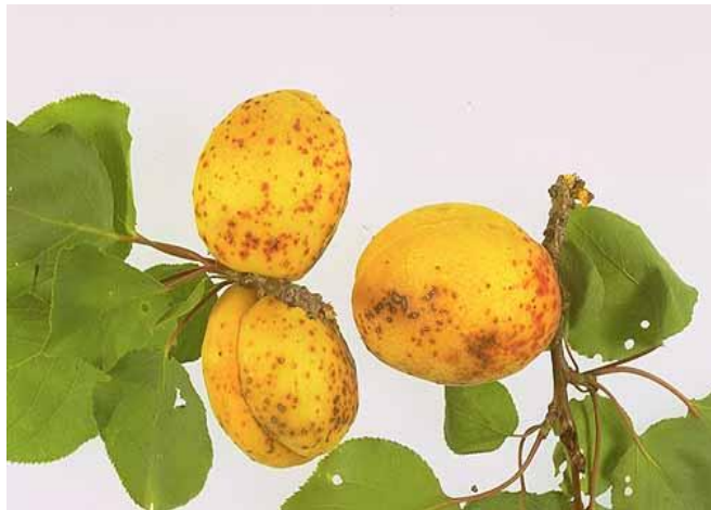
Σύμπτωμα κορύννεου σε ροδάκινα και βερίκοκα