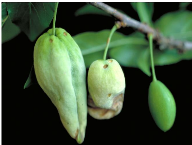
Σύμπτωμα εξώασκου σε φύλλωμα ροδακινιάς και σε καρπούς δαμασκηνιάς