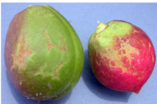
Προσβολή θρίπα σε νεκταρίνια.