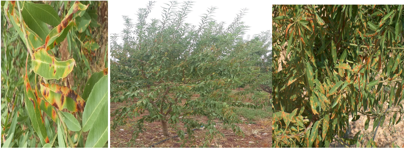
Εικ.4 5.6 ΠΚΠ.Φ Βόλου Προσβολή από ΠΟΛΥΣΤΙΓΜΩΣΗ ( Polystigma ochraceum )

Αναμένεται η εμφάνιση της πολυστίγμωσης μετά τις βροχοπτώσεις σε Αμυγδαλεώνες του Ν. Μαγνησίας (Ν. Αγγιάλος, Κανάλια) καθώς και σε περιοχές του Ν. Λάρισας και Ν. Φθιώτιδας.