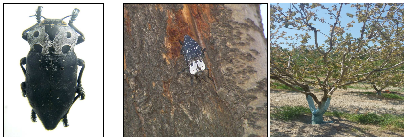
Εικ. Ακμαίο Καπνώδη και ξήρανση ολοκλήρου δέντρου που στις ρίζες του βρέθηκαν προνύμφες του εντόμου Capnodis tenebrionis

Πρόκειται για ένα μεγάλο μαύρο σκαθάρι με λευκή απόχρωση στη ράχη του. Τα τέλεια έντομα δραστηριοποιούνται την άνοιξη και τρέφονται από το φύλλωμα των δένδρων. Ωριμάζουν αναπαραγωγικά τον Μάιο και εναποθέτουν τα αυγά τους ένα-ένα ή σε ομάδες κυρίως στο έδαφος και κοντά στο λαιμό του δένδρου ή σε ρωγμές του φλοιού στη βάση του κορμού. Η νεαρή προνύμφη μπαίνει στο λαιμό ή στη βάση μίας ρίζας και ανοίγει στοά. Το δένδρο εξασθενίζει σιγά - σιγά και ξηραίνεται. Τα εξασθενημένα δένδρα έχουν μεγαλύτερη ευπάθεια στον καπνώδη.