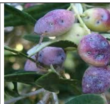
Εικόνα 3: Προσβολή σε καρπούς από ρυγχίτη

Έχουν παρατηρηθεί προσβολές από ρυγχίτη τοπικά σε όλες τις περιοχές της καλλιέργειας