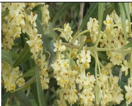
Εικόνα 1 Πλήρη άνθηση Εικ. ΠΚΠΦ Βόλου