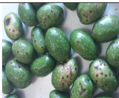
Εικόνα 2: Προσβολές σε καρπούς από ρυγχίτη