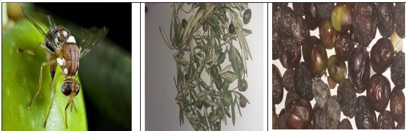
Εικόνα 11 Ακμαίο του Δάκου

Εικόνα 12, 13 Προσβολές καρπών από τον Δάκο στην Σκόπελο Μαγνησίας το 2016 και δευτερογενής προσβολή από Γλοιοσπόριο ( Gloeosporium olivarium ) και καμαροσπόριο ( camarosporio ) Εικ.Π.Κ.Π.Φ.@Π.Ε. Βόλου.