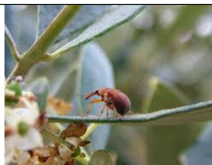
Εικόνα 1: Ακμαίο Ρυγχίτη