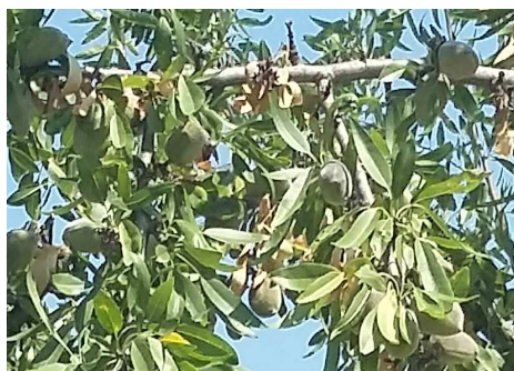
Εικ.1 Π.Κ.Π.Φ. Βόλου

Phomopsis amygdali (συν. Fusicoccum amygdali )