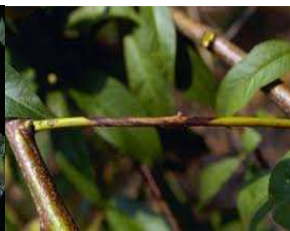
Εικ.3. Π.Κ.Π.Φ. Βόλου Προσβολή από Fusicoccum amygdali

Συνεχίζεται η παρουσία της Φώμοψης phomopsis amygdali (συν. Fusicoccum amygdali ) στις Αμυγδαλιές.