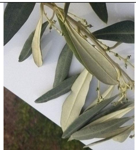
Εικόνες 4, 5, 6 Σχηματισμός μικ. Καρπών (Εικ. Π.Κ.Π.Φ, Βόλου ΣΤΑΔΙΑ ΠΟΥ-ΔΕΣΠΟΖΟΥΝ ΣΤΗΝ ΠΕΡΙΦΕΡΕΙΑ ΜΑΣ

Στις πολύ πρώιμες – πρώιμες και μεσοπρώιμες περιοχές η καρπόδεση έχει ολοκληρωθεί. Στις όψιμες συνεχίζεται η πτώση των πετάλων και η καρπόδεση. Παρατηρείται ανομοιομορφία στην καρπόδεση η