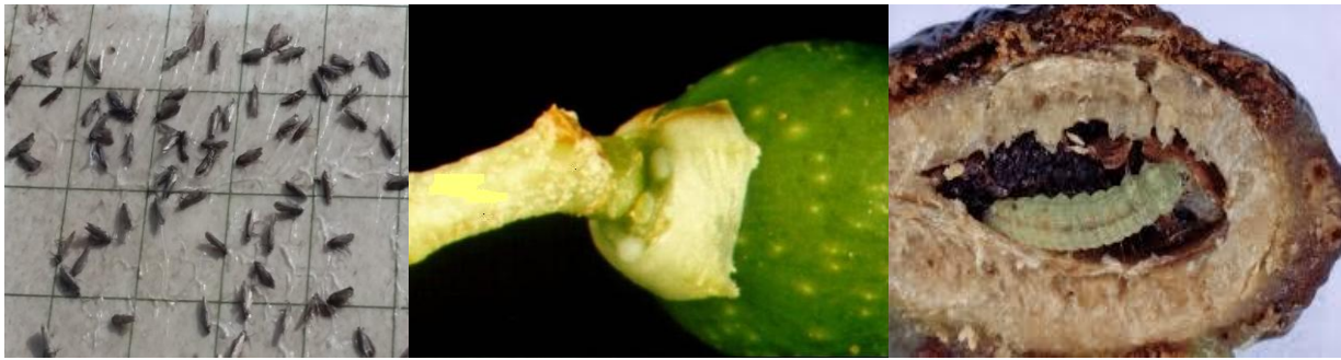
Εικόνα 7. Ακμαία του πυρηνοτρήτη σε παγίδες του ΠΚΠΦ Βόλου