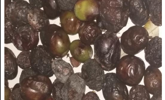
Εικόνα 18 Ακμαίο του Δάκου και δευτερογενής προσβολή από Γλοιοσπόριο ( Gloeosporium olivarum ), και καμαροσπόριο ( camarosporio )