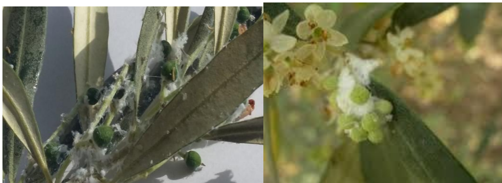
Εικόνα 10 11 Ψύλλα σε κλαδιά με καρπούς και ταξιανθία ελιάς

ΣΥΣΤΑΣΕΙΣ: Συνήθως οι προσβολές από το έντομο δεν έχουν επιπτώσεις στην παραγωγή. Να γίνει καταπολέμηση μόνο όπου υπάρχουν σοβαρές προσβολές με κατάλληλα φυτοπροστατευτικά σκευάσματα σε συνδυασμό με την καταπολέμηση του πυρηνοτρήτη.