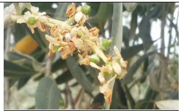
Εικόνα 3 Πτώση Πετάλων και προσβολή από πυρηνοτρήτη