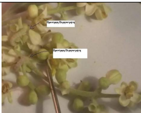
Εικόνα 2 Προνύμφες πυρηνοτρήτη