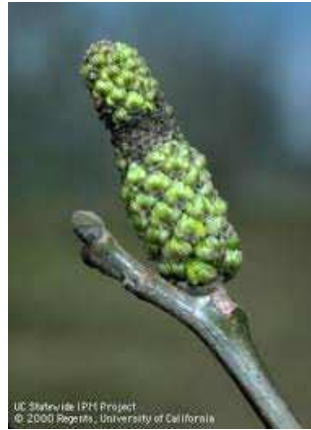
Εικ. 1 & 2. Προσβολή ιούλων