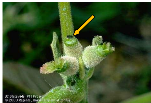
Εικ. 3. Προσβολή θηλυκού άνθους