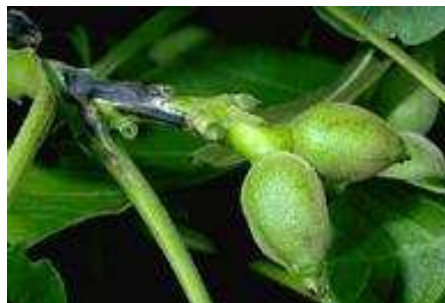
Εικ. 7. Προσβολή τρυφερού βλαστού