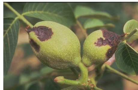
Εικ. 4 & 5. Προσβολή καρπών