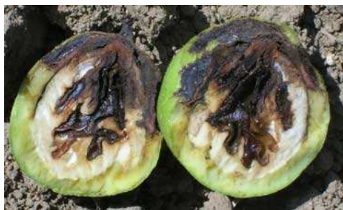
Εικ. 6. Μαύρισμα ψίχας