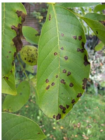
Εικ. 10. Προσβολή φύλλου