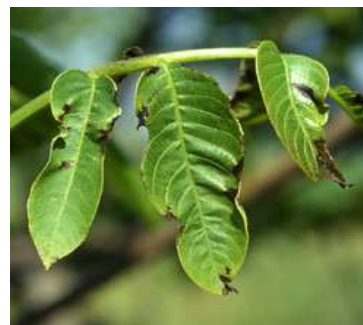
Εικ. 8 & 9. Προσβολή φύλλων