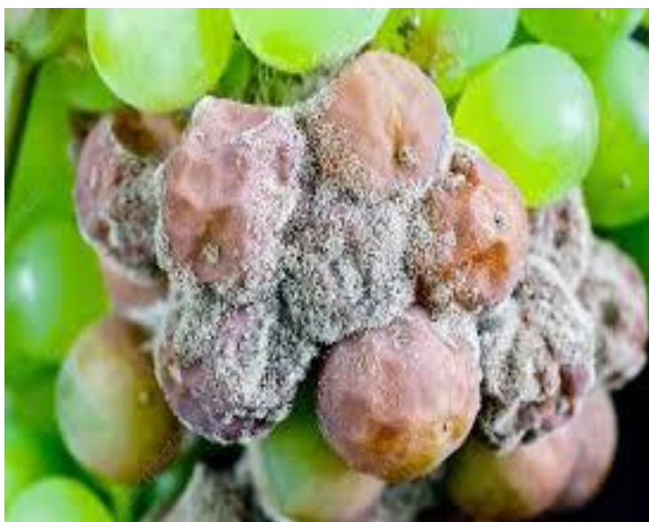
Προσβολή βοτρύτη σε σταφύλια.