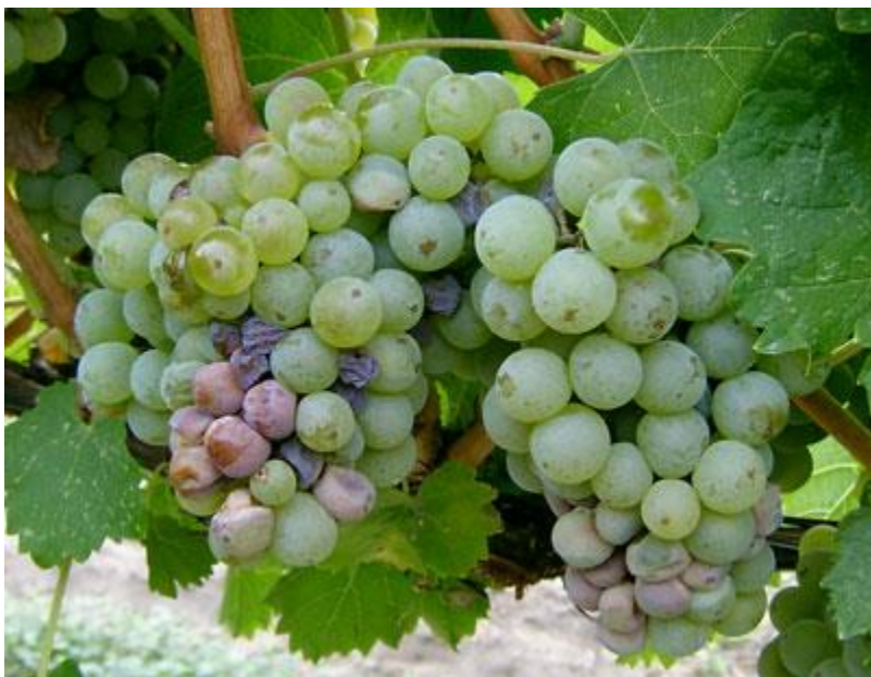
Οξινή σήψη σε σταφύλια.