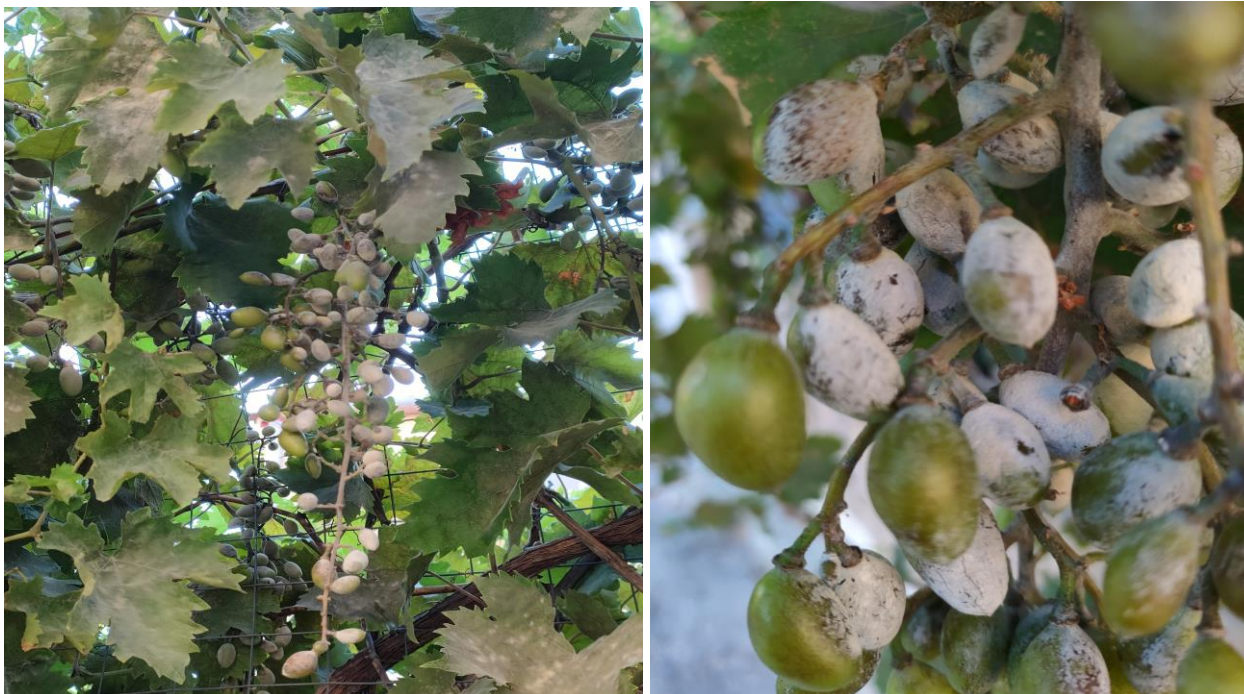
Ισχυρή προσβολή ωιδίου σε σταφύλια και φύλλωμα

Συνιστάται η συνέχιση της προστασίας των σταφυλιών από το ωίδιο, μέχρι τουλάχιστον και το στάδιο του “γυαλίσματος” των ραγών. Να προσεχθούν ιδιαίτερα τα αμπέλια που βρίσκονται σε περιοχές, στις οποίες η ασθένεια ενδημεί, καθώς επίσης και οι ευαίσθητες ποικιλίες. Επισημαίνεται ότι η καταπολέμηση του ωιδίου είναι κυρίως προληπτική, δεδομένου ότι η αντιμετώπιση της ασθένειας στην περίπτωση που έχουν εκδηλωθεί προσβολές από το παθογόνο, είναι εξαιρετικά δύσκολη και όχι πάντα αποτελεσματική.