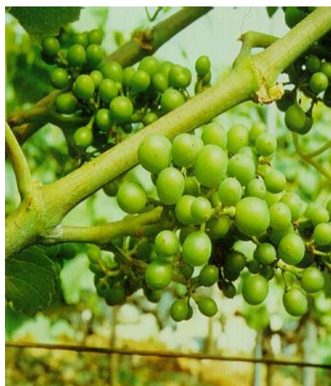
α) Τέλος άνθισης—καρπόδεση β) ράγες σε μέγεθος σκαγιού(3 χιλ.) γ) ράγες σε μέγεθος μπιζελιού (7 χιλ.)

Στις πιο πρώιμες περιοχές η άνθηση έχει ολοκληρωθεί και έχει αρχίσει η καρπόδεση.