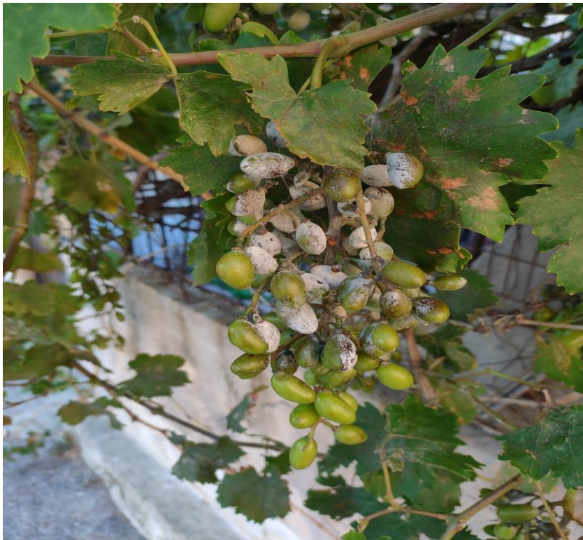
Ισχυρή προσβολή ωιδίου σε βότρου και φύλλωμα.

Το στάδιο της καρπόδεσης και οι 2-3 εβδομάδες που ακολουθούν είναι μία περίοδος πολύ κρίσιμη για την ανάπτυξη της ασθένειας και οι ζημιές που προκαλούνται είναι συνήθως καταστροφικές για την καλλιέργεια. Η προστασία των βοτρυών από τον μύκητα σε αυτή την περίοδο θεωρείται επιβεβλημένη. Επιπλέον, οι καιρικές συνθήκες των τελευταίων ημερών είναι ιδιαίτερα ευνοϊκές για την γρήγορη επέκταση της ασθένειας.