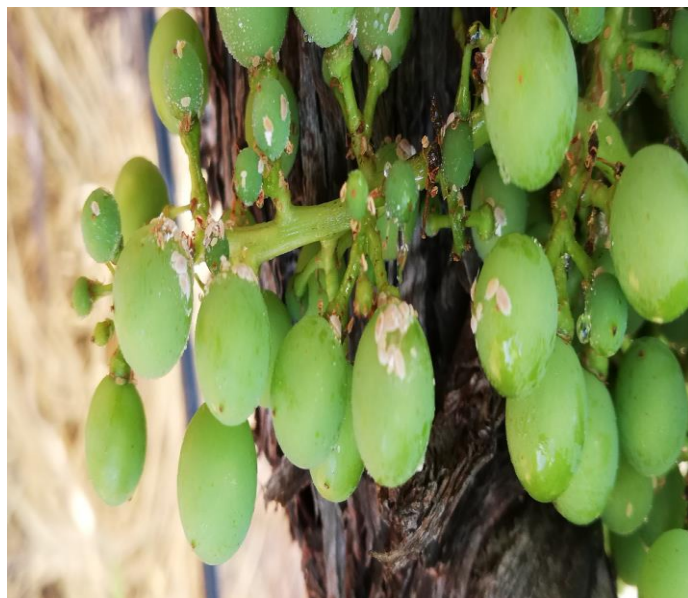
Αποικίες ψευδόκοκκων κάτω από ρυτιδώματα πρέμνου και πάνω στον βότρυ.