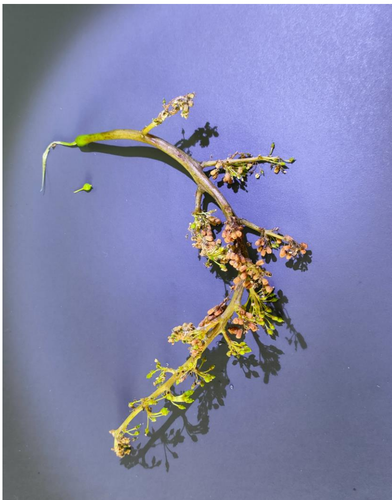
Προσβεβλημένη ανθοταξία από περονόσπορο.

Καλλιεργητικά μέτρα που βελτιώνουν την κυκλοφορία του αέρα μέσα στον αμπελώνα και συντελούν στο ταχύτερο στέγνωμα των φυτών από τη βροχή ή τη δροσιά, συμβάλουν καθοριστικά στον περιορισμό της σοβαρότητας της ασθένειας.