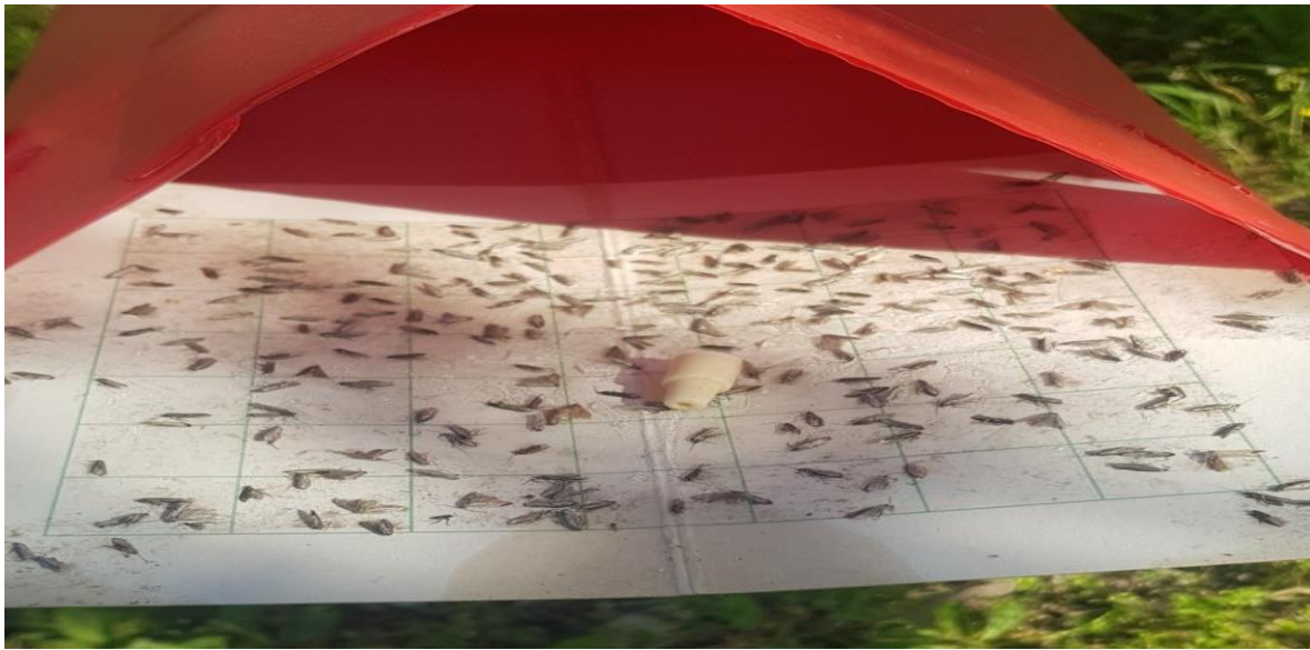
Συλλήψεις αρσενικών ακμαίων στις 18-04-2025 σε πεδινές περιοχές του ν. Μαγνησίας

Αντιθέτως, στο στάδιο του καρπιδίου η παρακολούθηση της πτητικής δραστηριότητας των ακμαίων της ανθόβιας γενιάς έχει ύψιστη σημασία για την προστασία της παραγωγής.