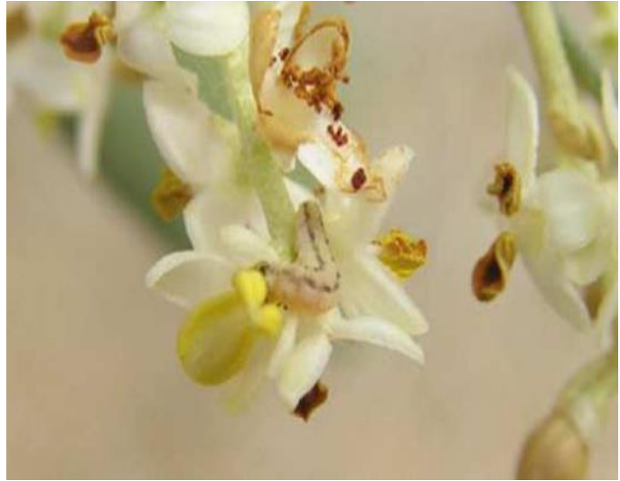
Προνύμφη πυρηνοτρήτη τρεφόμενη με τα αναπαραγωγικά όργανα των ανθέων.

Ο πυρηνοτρήτης και ο δάκος αποτελούν τους σπουδαιότερους εντομολογικούς εχθρούς της ελιάς, διότι είναι δυνατό να προκαλέσουν μεγάλη απώλεια στην παραγωγή.