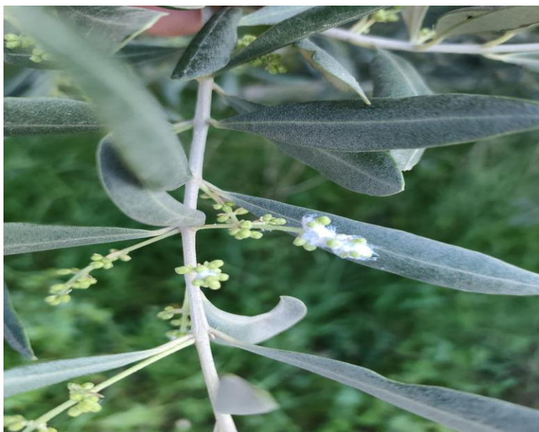
Βαμβακάδα προνυμφών ψύλλας σε ανθοταξίες.