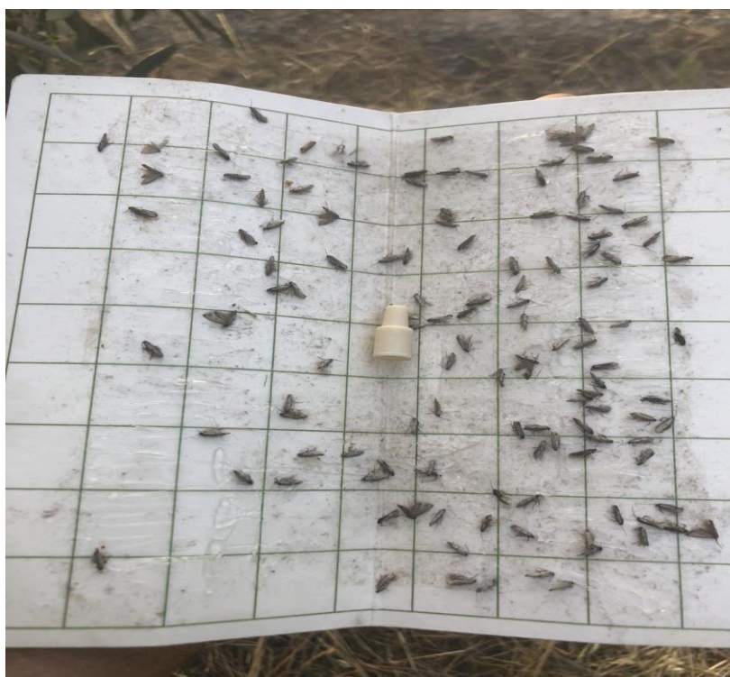
Αρσενικά ακμαία πυρηνοτρήτη σε κολλώδη επιφάνεια φερομονικής παγίδας.

Επισημαίνεται ότι κάθε ελαιώνας πρέπει να αντιμετωπίζεται ως ιδιαίτερη περίπτωση όσον αφορά την πορεία πτήσης των ακμαίων του πυρηνοτρήτη. Κάθε καλλιεργητής οφείλει να παρακολουθεί την πορεία πτήσης του εντόμου μέσω του δικτύου φερομονικών παγίδων στον ελαιώνα του.