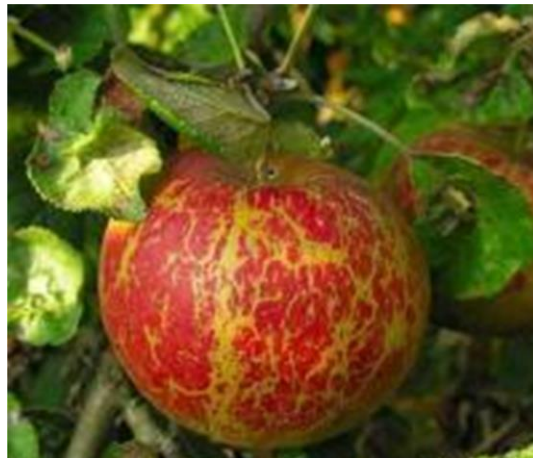
Εικ. 5-6. Προσβολή φύλλου και καρπού μηλιάς από ωίδιο