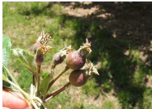
Εικ. 1-2. Χαρακτηριστικές κηλίδες σε φύλλα και νεαρούς καρπούς