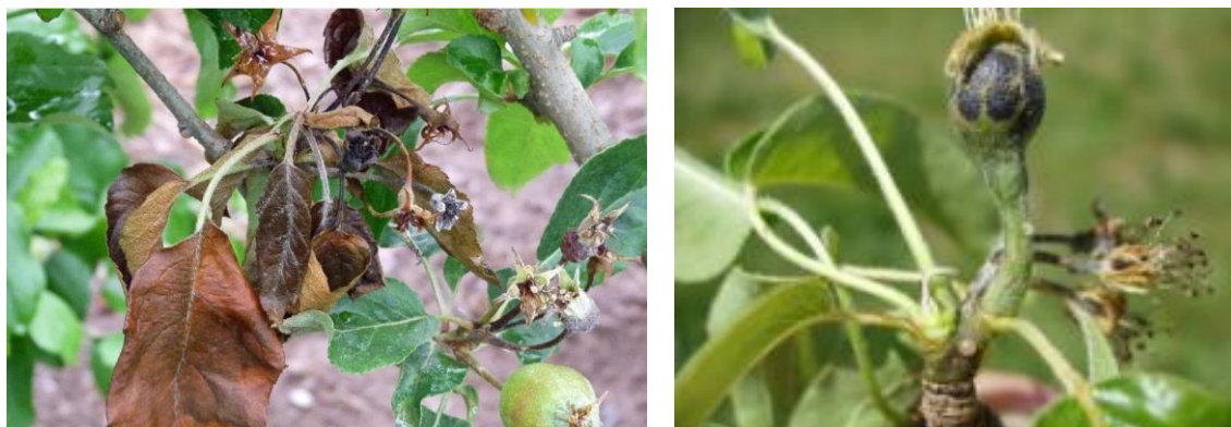
Εικ. 8-9. Προσβολή μηλιάς και αχλαδιάς από βακτηριακό κάψιμο

Η ασθένεια ευνοείται από μέτριες θερμοκρασίες και βροχερό ή υγρό καιρό, οπότε όταν οι καιρικές συνθήκες είναι ευνοϊκές, απαιτείται συνεχής προστασία της νεαρής βλάστησης.