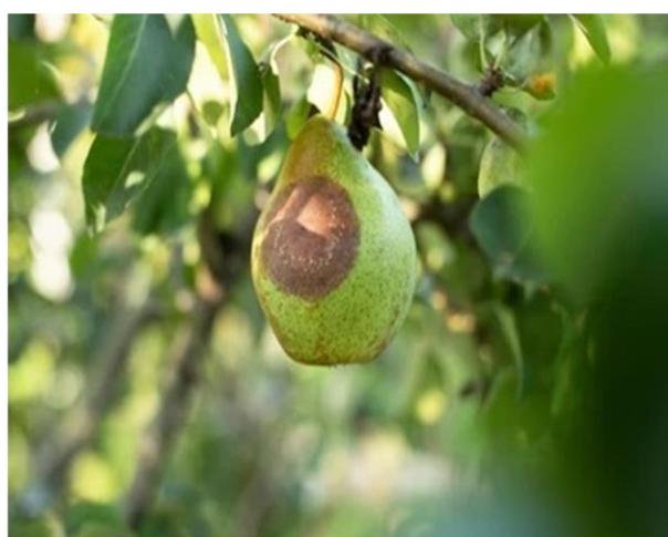
Εικ. 3-4. Προσβολή μονίλιας σε κλαδίσκο μηλιάς και καρπό αχλαδιάς

Στο παρόν βλαστικό στάδιο και εφόσον επικρατούν ευνοϊκές για την ασθένεια καιρικές συνθήκες, συνιστάται η συνέχιση της προστασίας της νεαρής βλάστησης. Επισημαίνεται, ότι η καταπολέμηση μπορεί να συνδυαστεί με εκείνη για τα φουζικλάδια.