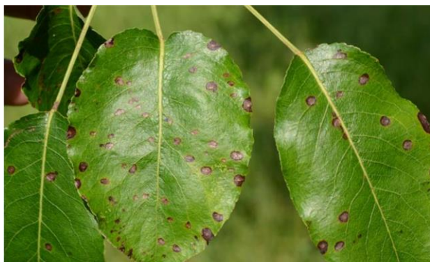
Εικ. 7. Προσβολή φύλλων αχλαδιάς από σεπτορίωση

Η ασθένεια προσβάλλει κυρίως τα φύλλα, τα οποία σε έντονες προσβολές πέφτουν πρόωρα. Ο υγρός και σχετικά θερμός καιρός ευνοεί την επέκταση και διάδοση της ασθένειας. Όταν επικρατούν τέτοιες συνθήκες η προστασία της καλλιέργειας είναι απαραίτητη και μπορεί να επιτευχθεί σε συνδυασμό με την καταπολέμηση του φουζικλαδίου.