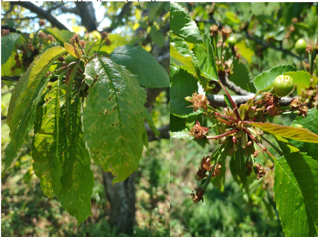
Ισχυρή προσβολή κορύννεου σε φύλλωμα και καρπό κερασιάς.

Κατά την επιλογή του μυκητοκτόνου, ιδιαίτερη προσοχή πρέπει να δοθεί στο διάστημα μεταξύ τελευταίας επέμβασης και συγκομιδής.