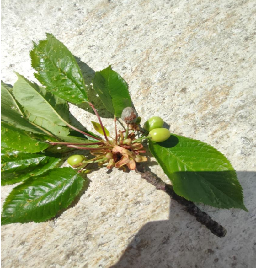
Προσβολή μονίλιας σε καρπό κερασιού.

Κατά την επιλογή του μυκητοκτόνου, ιδιαίτερη προσοχή πρέπει να δοθεί στο διάστημα μεταξύ τελευταίας επέμβασης και συγκομιδής.