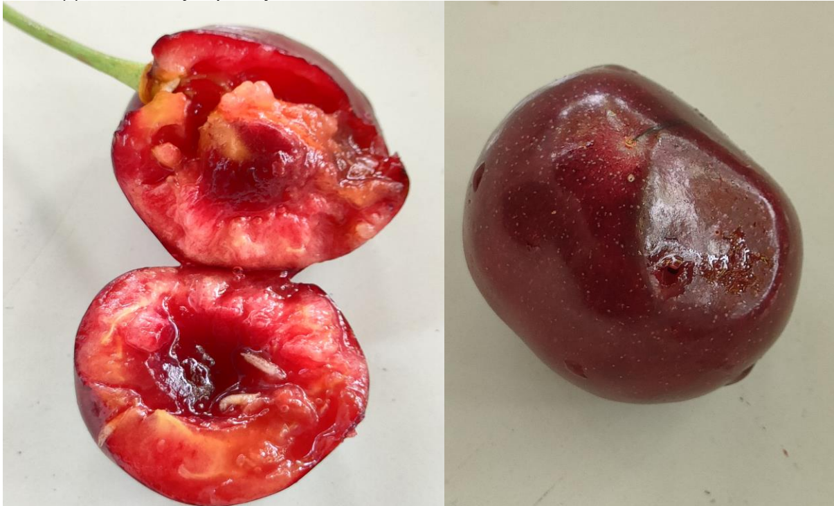
Προσβολή κερασιού από προνύμφη ραγολέτιδας.

Επειδή ο χρόνος μεταξύ έναρξης προσβολής και συγκομιδής είναι μικρός, να δοθεί μεγάλη προσοχή στην επιλογή των εντομοκτόνων, ώστε να μην υπάρξει κίνδυνος υπολειμμάτων στους καρπούς.