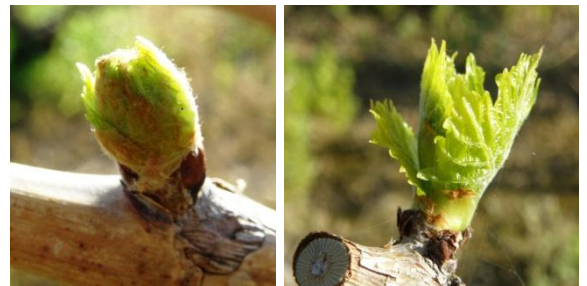
Πράσινη κορυφή - έξοδος φύλλων (στάδια C - D)