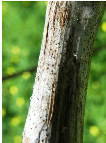
Εικ.5. Κληματίδα το χειμώνα. Γκριζόλευκη με σκισίματα και μικρά μαύρα στίγματα (πυκνίδια)

Οι προσβολές είναι έντονες σε περιοχές με βροχερή και θερμή άνοιξη. Στις συνθήκες της Κρήτης, κρίσιμο θεωρείται το διάστημα μέσα Μαρτίου – αρχές Απριλίου.