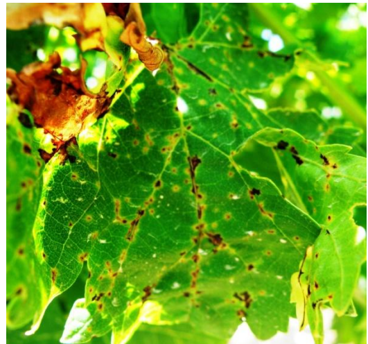
Εικ.1. Προσβολές σε φύλλο

Στη βάση του ελάσματος και επάνω στα νεύρα μικρές κυκλικές κηλίδες, κίτρινες στην περιφέρεια και μαύρες στο κέντρο (Εικ.1). Φύλλα έντονα προσβεβλημένα ξεραίνονται, το έλασμα πέφτει αλλά ο μίσχος συνήθως μένει στον βλαστό.