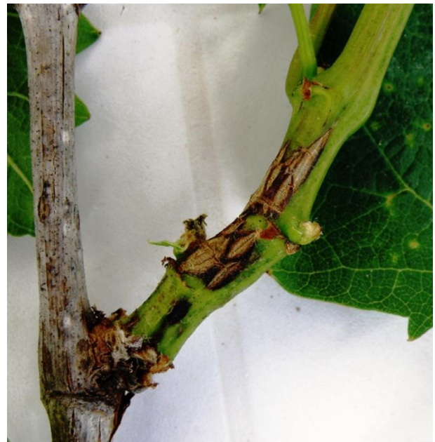
Εικ.4. Βλαστός προηγούμενου έτους με πυκνίδια (αρις) και νέος βλαστός με έλκη (δεξ).