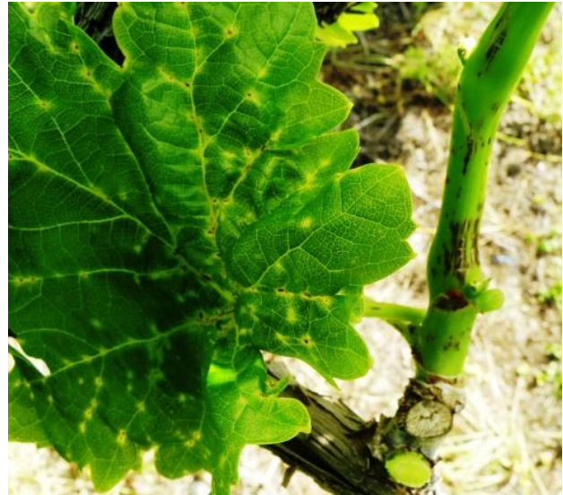
Εικ.3. Προσβολές σε βλαστό και φύλλο

Οι ταξιανθίες αποβάλλουν γρήγορα τα άνθη τους.