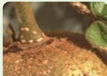
Εικ. 1.

Η βαμβακάδα αποτελεί έναν από τους σοβαρότερους εχθρούς της καλλιέργειας. Προσβάλλει τον κορμό, τα κλαδιά και τους καρπούς. Διαχειμάζει με τη μορφή ενήλικου θηλυκού και από τα μέσα Απριλίου ξεκινούν οι ωτοκίες. Πολλαπλασιάζεται με μεγάλη ταχύτητα και έχει τρεις γενιές το έτος. Το έντομο απομυζά χυμούς από το φυτό προκαλώντας την ξήρανση των κλαδιών και σταδιακά την εξασθένησή του. Σημαντικές είναι και οι ζημιές στον καρπό. Στα σημεία προσβολής τους δημιουργούνται πληγές με αποτέλεσμα να αναπτύσσονται σήψεις. Αυτό μειώνει το χρόνο διατήρησης των καρπών και μπορεί να οδηγήσει σε υποβάθμιση της ποιότητας και της εμπορικής αξίας του προϊόντος. Κατάλληλη περίοδος για τη χημική καταπολέμηση του εντόμου είναι η περίοδος που πραγματοποιούνται οι εκκολάψεις (Απρίλιος – Μάιος).