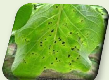
Εικόνα 1

Προσβάλλει φύλλα, κλαδιά και βραχίονες. Τα πρώτα συμπτώματα της προσβολής παρατηρούνται στα φύλλα την άνοιξη (καστανές γωνιώδεις κηλίδες με χλωρωτική άλω - συμπτώματα μάρανσης και νέκρωσης). Κατά τη διάρκεια του χειμώνα μικρά σταγονίδια γαλακτόχρωμου υγρού εμφανίζονται στην επιφάνεια του κορμού καθώς και των κύριων και δευτερευόντων κλάδων. Παρατηρείται μεταχρωματισμός της επιφάνειας του κορμού που συνοδεύεται από βακτηριακά εκκρίματα εξερχόμενα από το έλκος τα οποία αποξηραίνονται στον φλοιό.