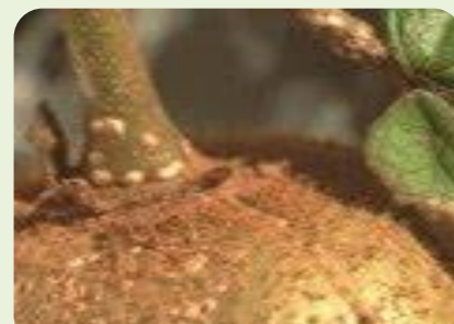
Εικ. 1.

Η βαμβακάδα αποτελεί έναν από τους σοβαρότερους εχθρούς της καλλιέργειας. Προσβάλλει τον κορμό, τα κλαδιά και τους καρπούς. Διαχειμάζει με τη μορφή ενήλικου θηλυκού και από τα μέσα Απριλίου ξεκινούν οι ωοτοκίες. Πολλαπλασιάζεται με μεγάλη ταχύτητα και έχει τρεις γενιές το έτος. Το έντομο απομυζά χυμούς από το φυτό προκαλώντας την ξήρανση των κλαδιών και σταδιακά την εξασθένησή του. Σημαντικές είναι και οι ζημιές στον καρπό. Στα σημεία προσβολής τους δημιουργούνται πληγές με αποτέλεσμα να αναπτύσσονται σήψεις. Αυτό μειώνει το χρόνο διατήρησης των καρπών και μπορεί να οδηγήσει σε υποβάθμιση της ποιότητας και της εμπορικής αξίας του προϊόντος. Κατάλληλη περίοδος για τη χημική καταπολέμηση του εντόμου είναι η περίοδος που πραγματοποιούνται οι εκκολάψεις (Απρίλιος – Μάιος).