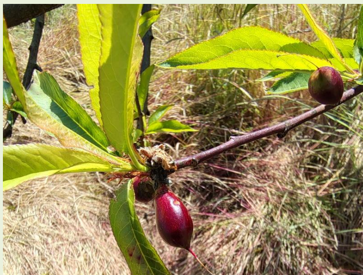
Εικόνα:1 (Νεκταρίνια), Δ.Α.Ο.Κ ΔΡΑΜΑΣ

Καρπόκαψα ( Grapholita molesta ) ( Grapholita funebrana )