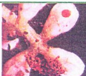
Προσβολή σε άνθος