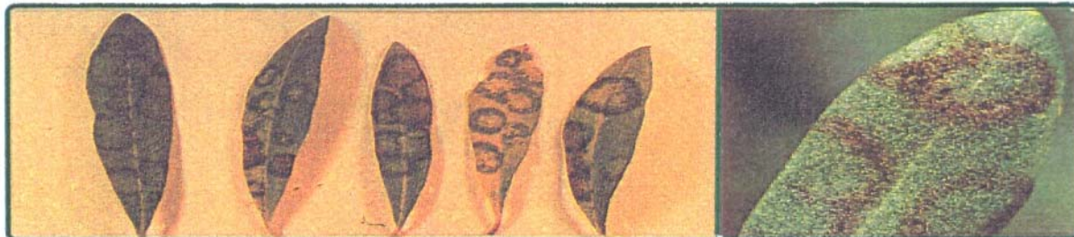
Φύλλα προσβεβλημένα από κυκλοκόνιο

Πληροφορίες: ΚΩΝΣΤΑΝΤΙΝΟΣ ΛΙΑΗΣ Τηλ.: 2510 / 600421