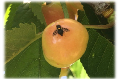
Εικόνα 1. Rhagoletis cerasi

Η μύγα της κερασιάς αποτελεί πολύ σοβαρό εχθρό των κερασιών. Εμφανίζεται συνήθως προς τα τέλη Απριλίου - αρχές Μαΐου, ανάλογα με τις επικρατούσες καιρικές συνθήκες και εναποθέτει τα αυγά της στο εσωτερικό των μικρών καρπών. Από τα αυγά αυτά αναπτύσσονται οι προνύμφες, οι οποίες τρέφονται από τη σάρκα των καρπών. Οι προνύμφες αφού συμπληρώσουν την ανάπτυξή τους βγαίνουν από το κεράσι, πέφτουν στο χώμα και διαχειμάζουν.