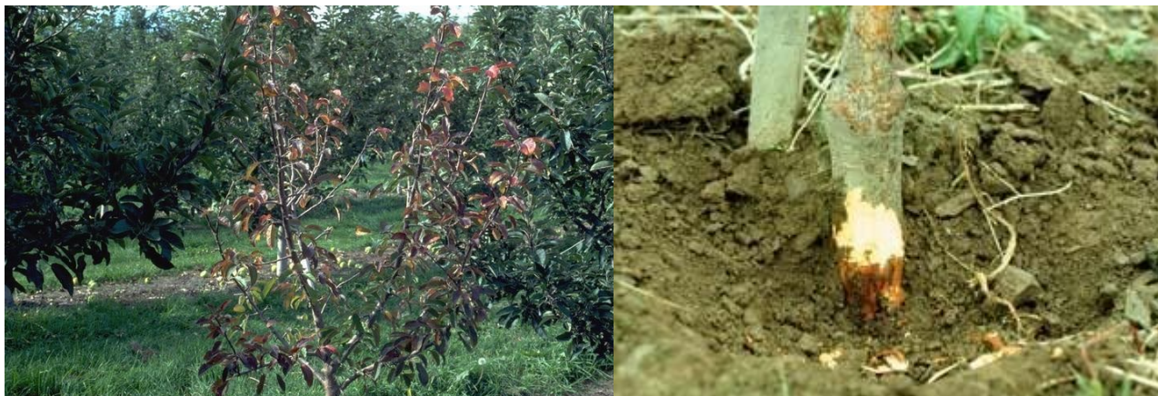
προσβολή Μηλιάς από Phytophthora