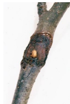
προσβολή Μηλιάς από Nectria galligena