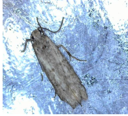
Πυρηνοτρήτης ( Prays oleae )