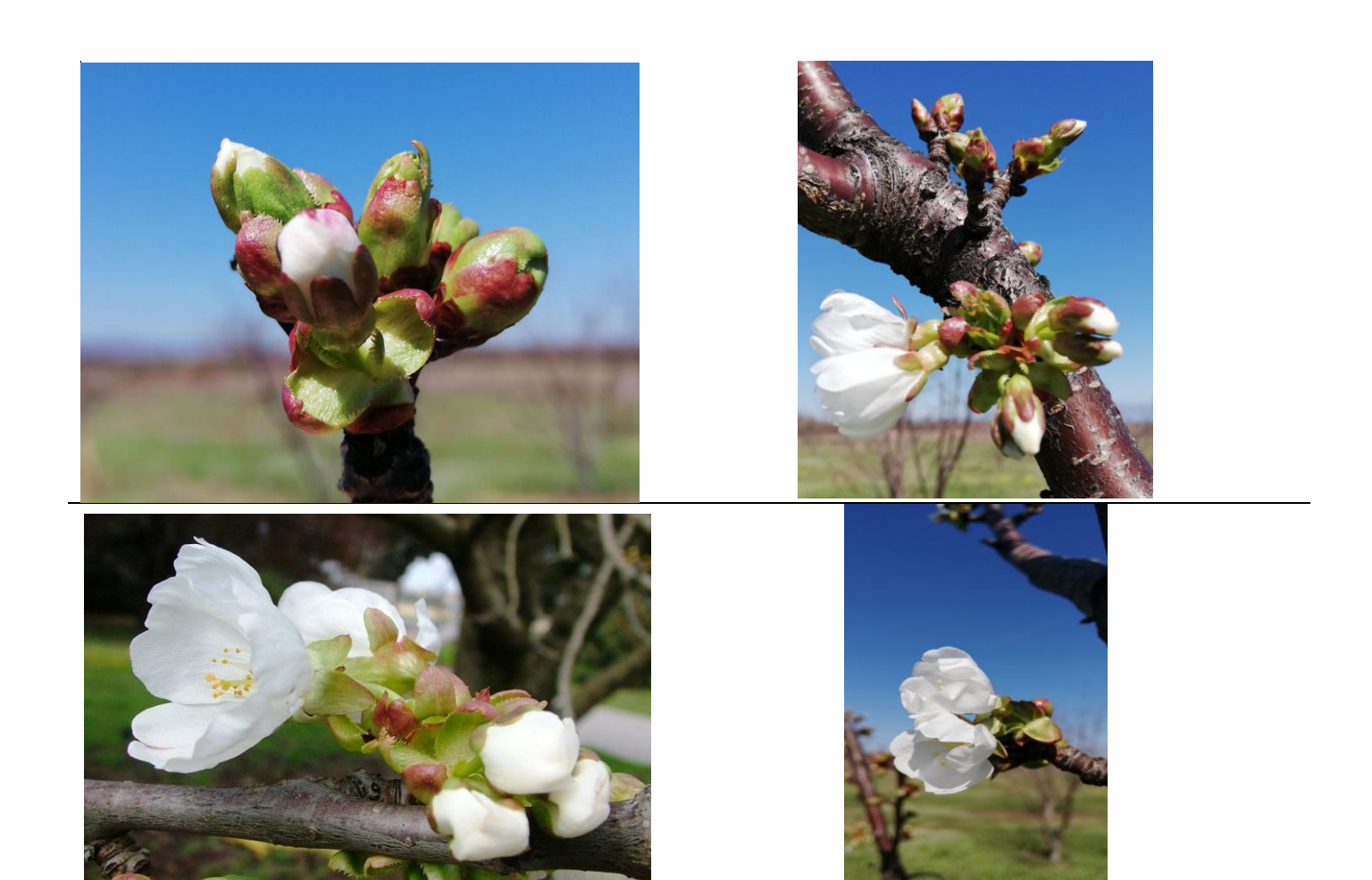
Λευκή κορυφή – Έναρξη άνθησης